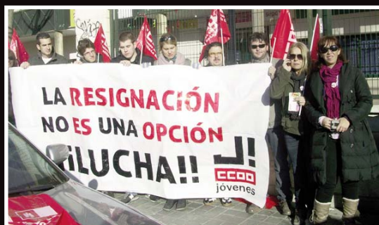
Acción de calle de CCOO sobre paro juvenil y consecuencias de la Reforma Laboral

evidente que sí ha atendido las reclamaciones de las patronales más retrógradas de nuestro país y ha elaborado un Decreto que refuerza el poder del empresario en las relaciones laborales y desarma a los trabajadores.