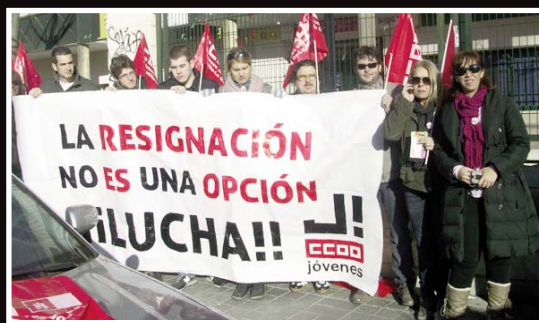
Acción de calle de CCOO sobre paro juvenil y consecuencias de la Reforma Laboral

evidente que sí ha atendido las reclamaciones de las patronales más retrógradas de nuestro país y ha elaborado un Decreto que refuerza el poder del empresario en las relaciones laborales y desarma a los trabajadores.