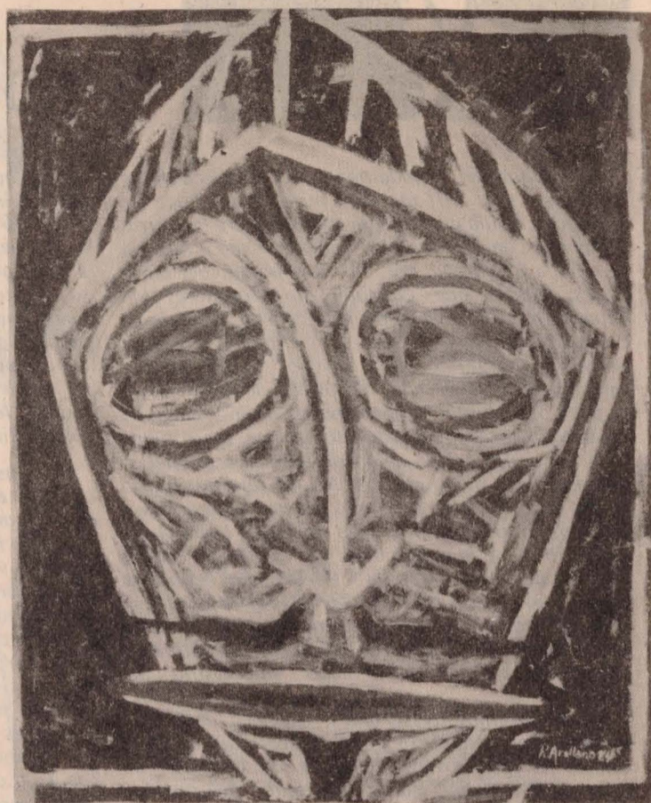
"HEROE, 2". Acrílico sobre tela 210 x 180 cms.

Y cuando las borrascas procedentes del país de la palabra, amenazan el caudal que recibe la pintura española de sus propias fuentes, resulta vivificante encontrar cuadros al resguardo del aguacero. La Feria estaba a punto de cerrar sus puertas, cuando once creaciones de Rafael Arellano se colgaban en una exigua salita de Toledo, mostrando en su respetuosa fortaleza, el renuevo de un mundo "después de la lluvia". El rutilante complejo constructivo del color, en esa "Conversación Otoñal" que desde sus 2,80x2,00, impone sus