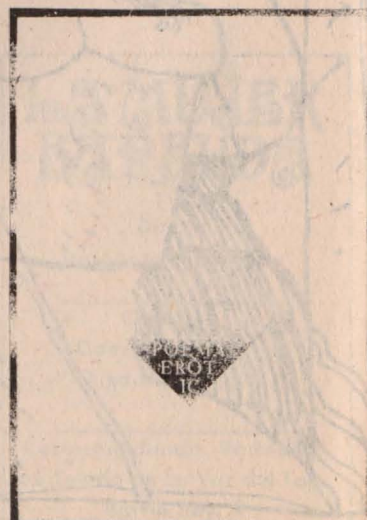
Poema de J.M. Calleja