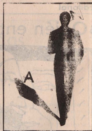
Poema de Xavier Canals