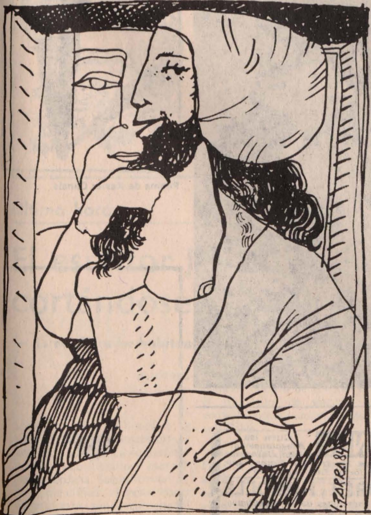
Dibujo de Isidro Parra