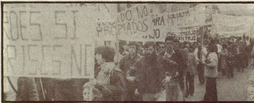
Barrio de Covachuelas