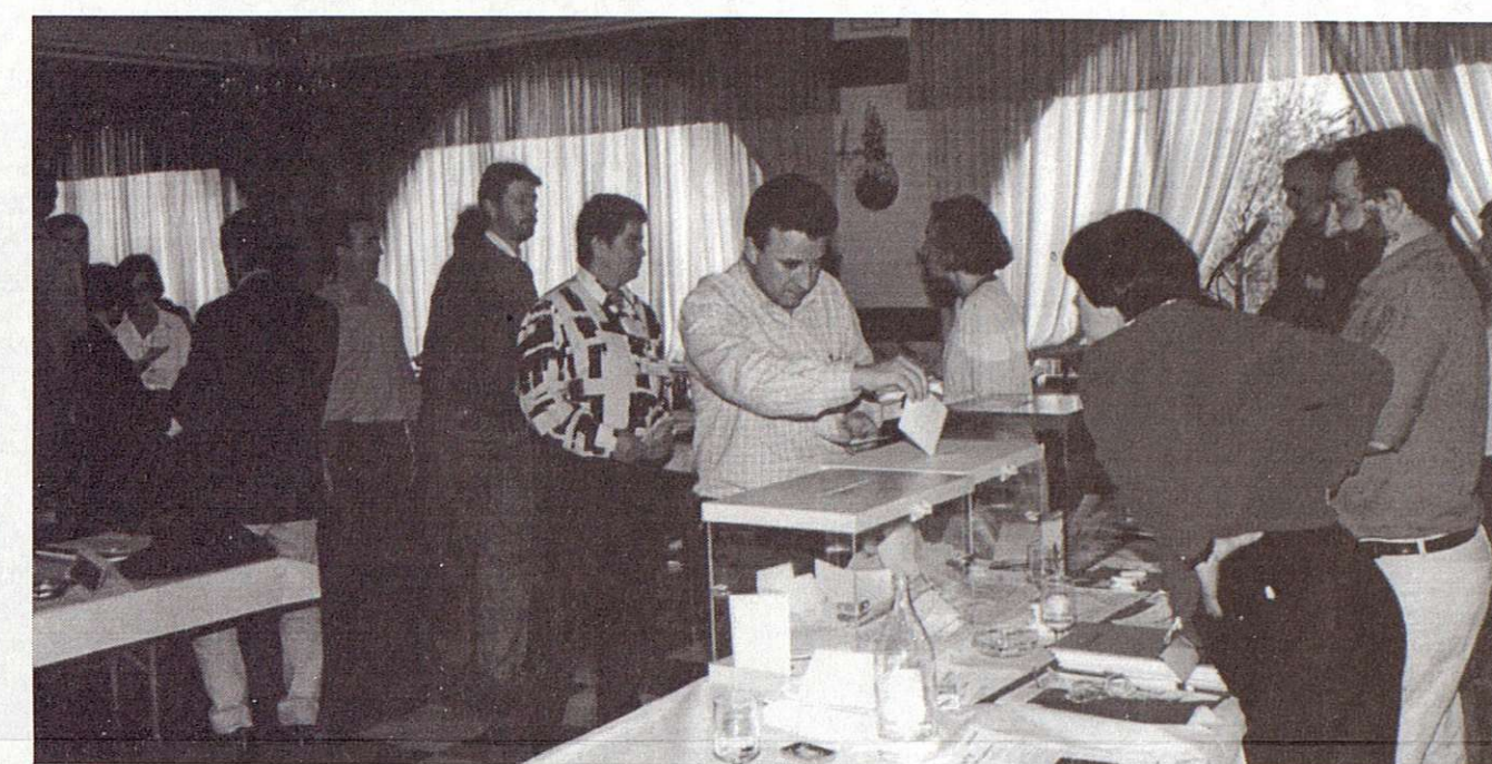
En el Congreso se debatirán las líneas de actuación sindical y se elegirá la dirección del sindicato.