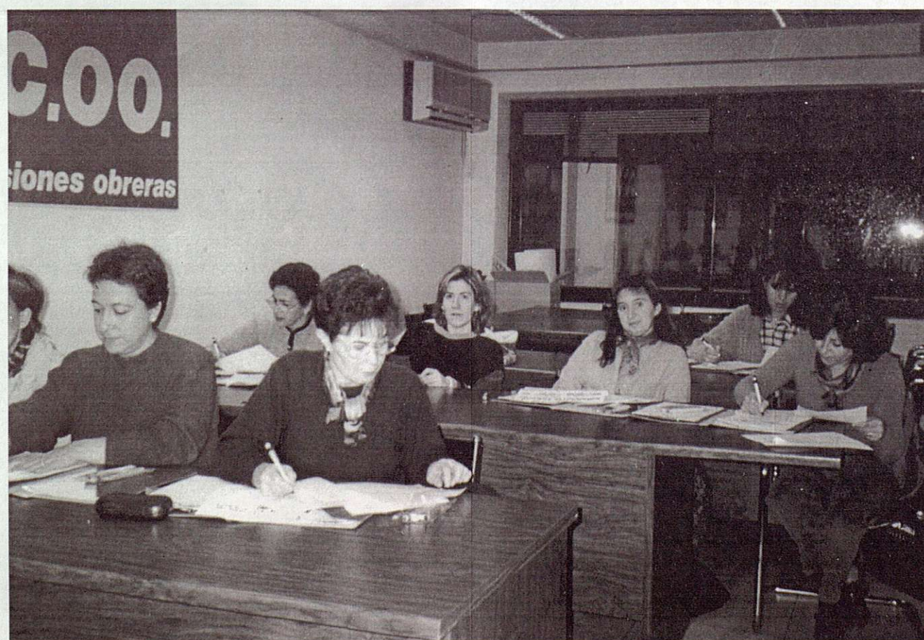
CC.OO. impulsa acciones positivas dirigidas a colectivos que sufren discriminación.

Questionar el modelo desigual de reparto del trabajo y de las responsabilidades familiares en razón del sexo; tener en cuenta que los jóvenes son quienes más sufren el desempleo y la precariedad; favorecer el acceso al empleo de los discapacitados en condiciones de igualdad; impulsar la integración social y laboral de los inmigrantes; son tareas a realizar por el sindicato, vinculando a estos colectivos y propiciando su participación en la actividad sindical.