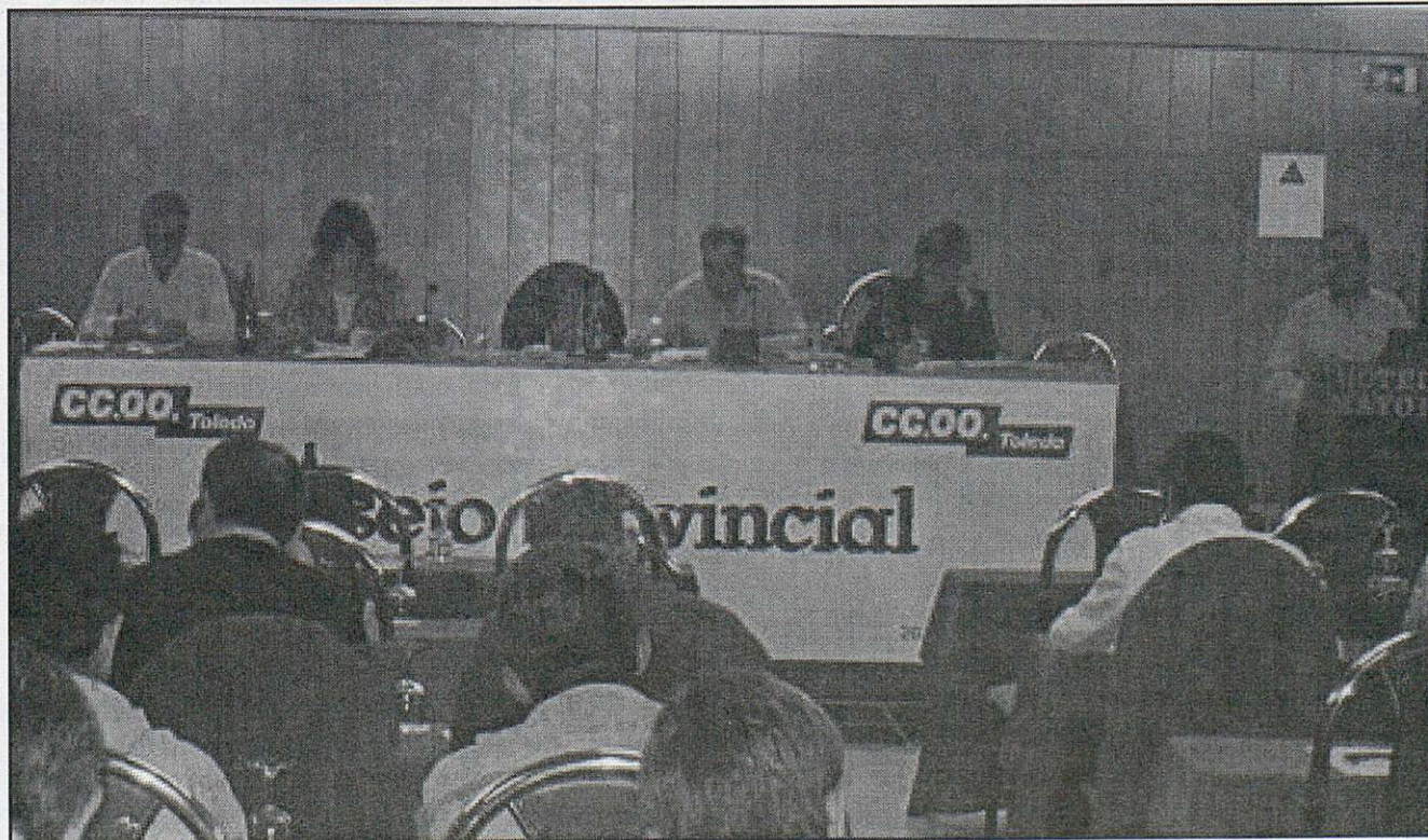
Asistentes al Consejo de la Unión Provincial de CC.OO. de Toledo

Estoy convencido que cada uno de nosotros y nosotras aportaremos en esta situación lo mejor sacaremos el sindicalista que llevamos dentro y sabremos mantener, a pesar de las discusiones necesarias, ese compromiso compartido, en la seguridad de que unas CC.OO. fuertes y unidas son la mejor garantía de eficacia, al servicio de los trabajadores y trabajadoras de nuestra provincia.