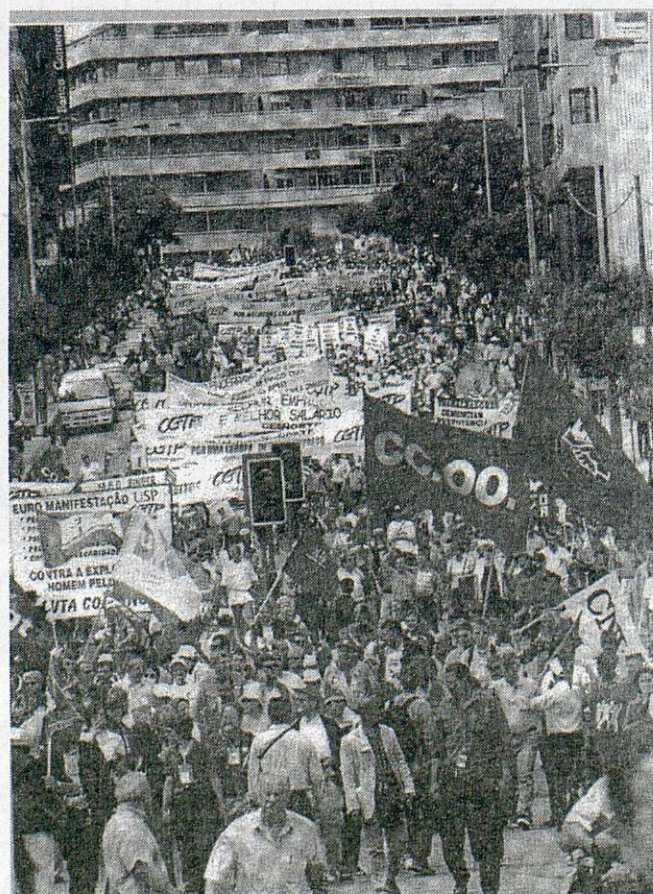
Más de 50.000 trabajadores europeos se manifestaron por las calles de Oporto

A la manifestación, que durante más de tres horas recorrió las calles de la ciudad portuguesa, asistieron más de 50.000 representantes de todos los sindicatos de Europa, entre ellos varias decenas de sindicalistas de CC.OO. de Toledo.