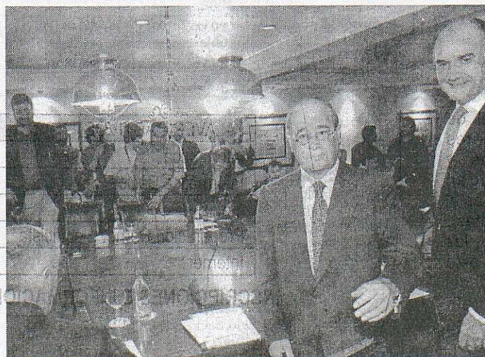
Los dirigentes empresariales y sindicales antes del comienzo de la reunión

fraudulentas", las citadas rondas de reuniones se va a desarrollar durante los próximos meses con la patronal y se mantendrán reuniones periódicas con el Gobierno, sobre éste y otros temas, entre los que destaca la cuestión de las pensiones.