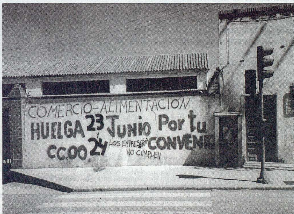
La segunda convocatoria de huelga, prevista para los días 23 y 24 de junio no llegó a realizarse al firmar la patronal el acuerdo.

Balances e inventarios y el trabajo Nocturno. Garantiza el disfrute de Vacaciones en algún caso de I.T. Amplia y clarifica lo relativo a Permisos y Licencias limitando y regulando las Horas Extras.