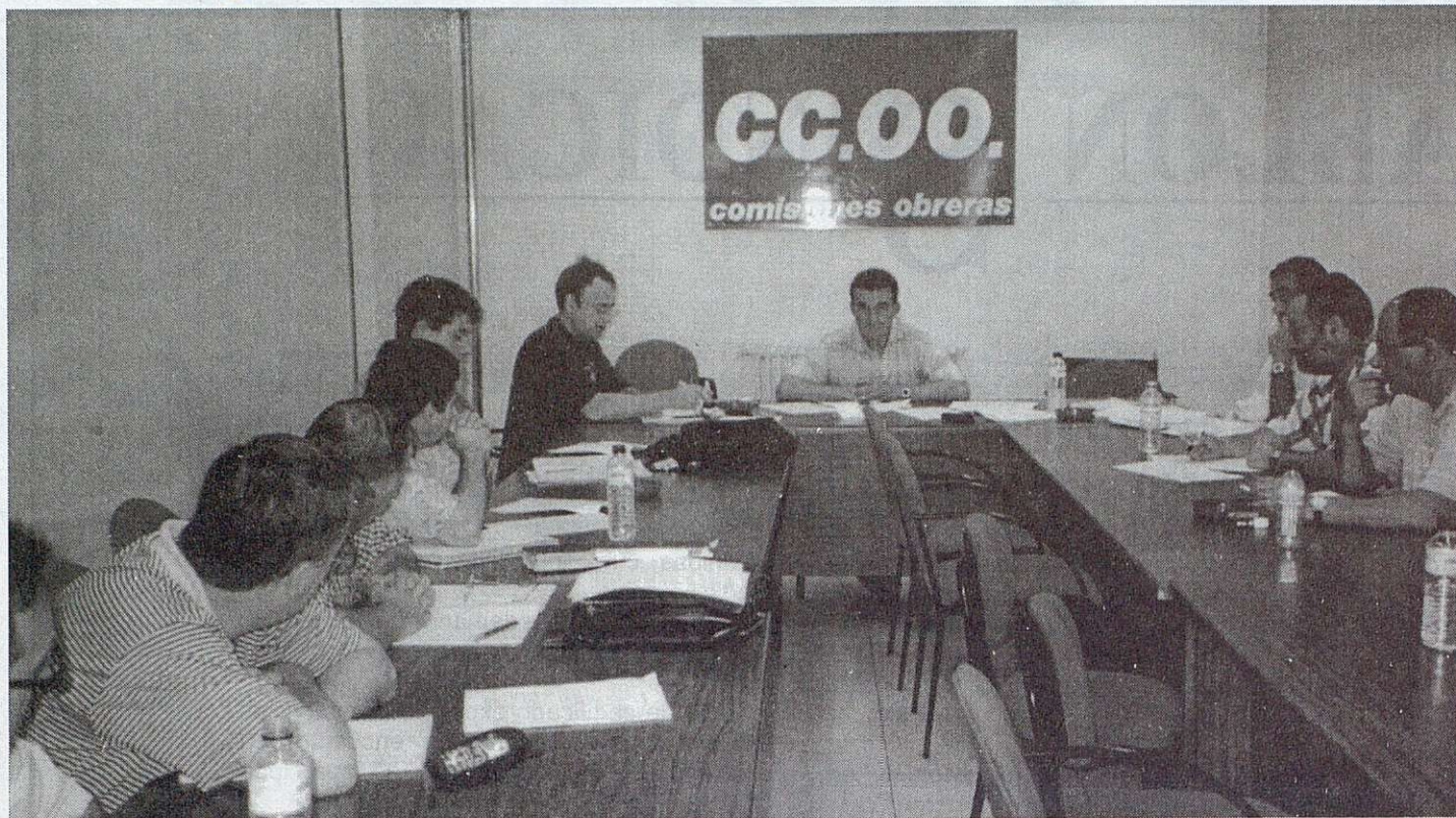
Reunión de la Ejecutiva Provincial de CC.OO. El pasado 30 de junio.