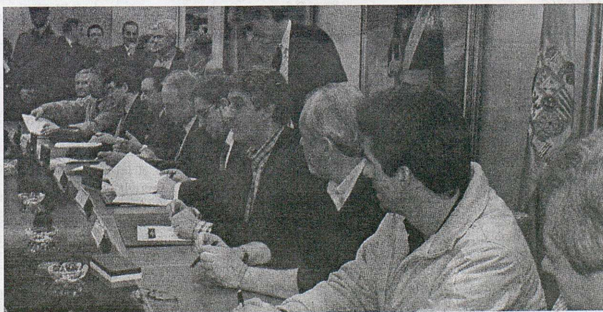
Momento de la firma de los acuerdos

La carga de trabajo, el respeto de los derechos de los trabajadores y las trabajadoras, la consolidación de la industria auxiliar, el establecimiento de garantías de cara a la creación de una nueva estructura societaria, así como un plan industrial que dé prioridad a la especialización de cada uno de los centros han sido las principales reivindicaciones sindicales que recoge el documento. Este fue firmado por la FM de CC.OO., MCA-UGT y USTG, así como la Sepi y la dirección de Izar, pudiendo adherirse, con posterioridad, el resto de sindicatos.