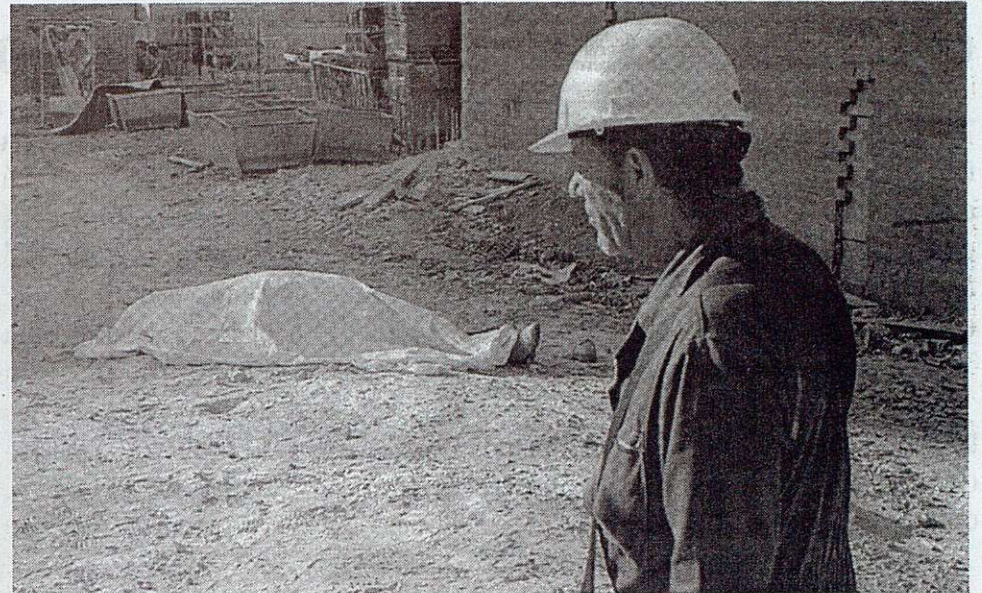
Un obrero observa el cuerpo de su compañero muerto en accidente.

que de lugar a una Ley que regule la selva de contratas y subcontratas en la que está inmerso el sector, una regulación que entre otros efectos tendría el de reducir el número de accidentes laborales y muertes.