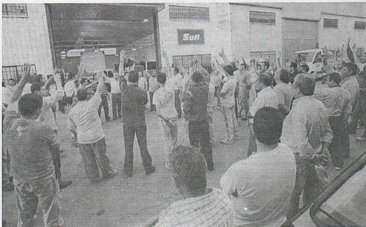
En la foto, los trabajadores de Sufi ratifican en asamblea el acuerdo logrado y el fin de la huelga.

Los trabajadores de la empresa SUFI -concesionaria del servicio de limpieza y recogidas de basuras de Toledo- tras tensas negociaciones que desembocaron en una huelga, han conseguido llegar a un acuerdo en su convenio colectivo. La intransigencia de la empresa durante las negociaciones hizo que los trabajadores tuvieran que recurrir a la huelga, fue entonces cuando la postura de la empresa y sus planteamientos se acercaron a las propuestas de los trabajadores y pudo llegarse finalmente a un acuerdo. Un acuerdo que contempla, entre otros puntos, una serie de pluses para todos los trabajadores -que solo cobraba parte de la plantilla-, la recuperación del plus de antigüedad y una subida salarial que supone, en los tres años de vigencia del convenio, ganarle un 2,25% a las subidas reales de los IPC's