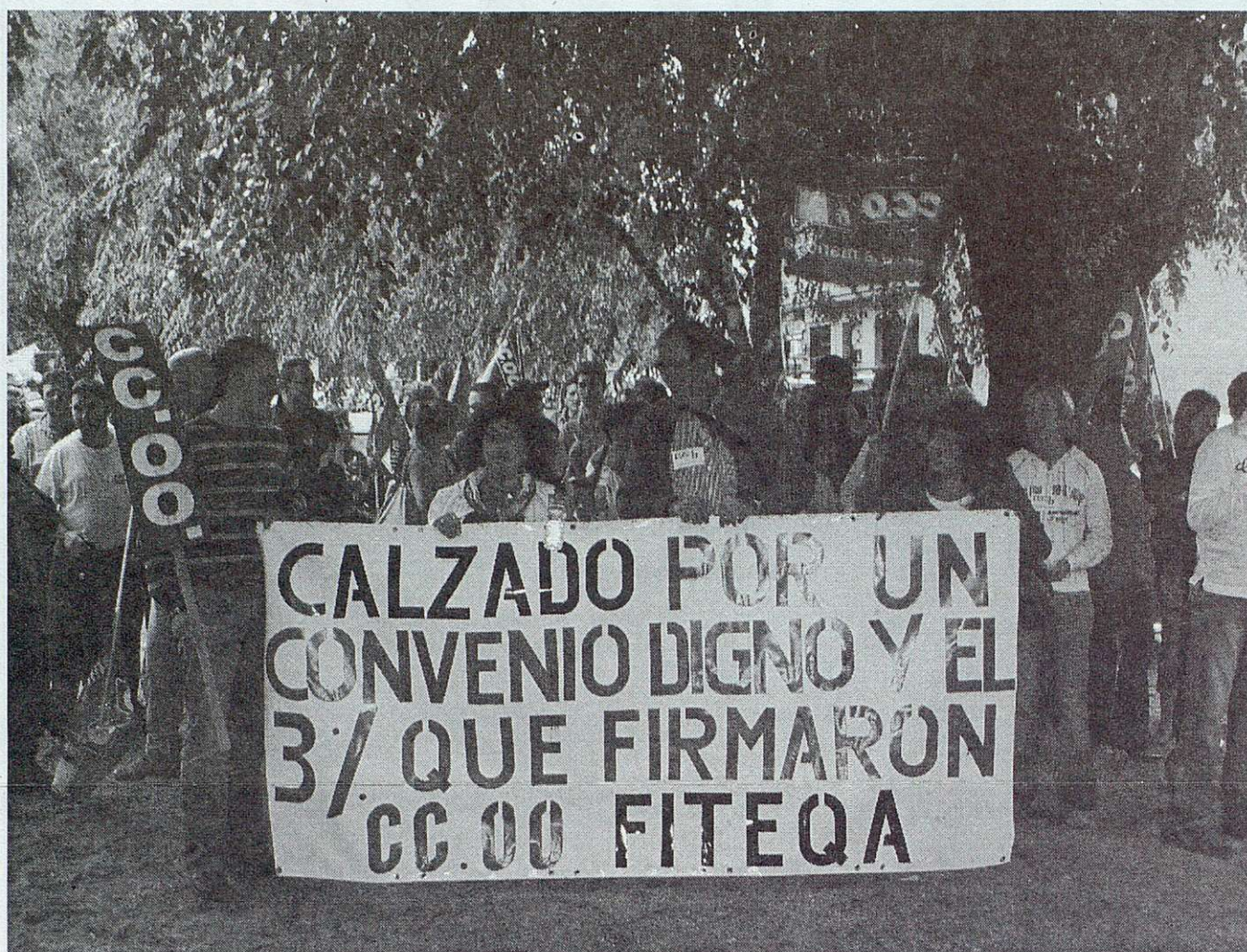
Los trabajadores/as del calzado irán a la huelga los días 20, 21, 27 y 28 de junio en defensa de un convenio digno

atender a menores o mayores a su cargo. La Ejecutiva decidió realizar un envío a los más de 1.500 delegados y delegadas de CC.OO. con toda la información al respecto, para que la publiquen en los centros de trabajo de la provincia, así como ayudas en la gestión de solicitudes a los afiliados y a filiadas de CC.OO. (requisitos y plazos para solicitar las ayudas... ver Pág. 4).