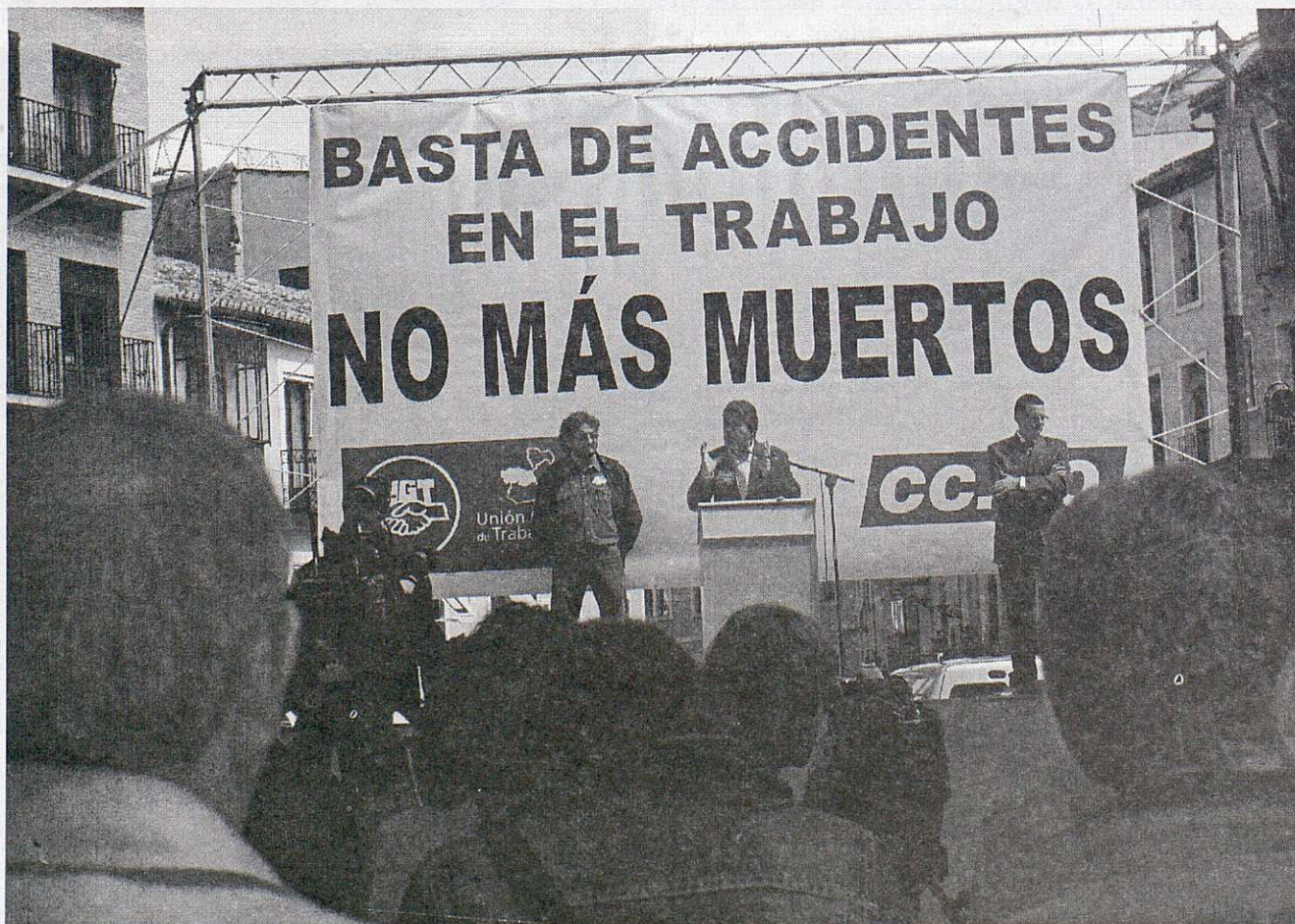
El pasado 27 de abril, cientos de delegados/as sindicales se concentraron en Toledo contra la siniestralidad laboral

Ayudas a los trabajadores con hijos menores. La Ejecutiva provincial decidió poner en marcha una nueva campaña de información en los centros de trabajo para todos aquellos trabajadores con hijos menores de ocho años (cuando trabajen los dos cónyuges), pues podrán solicitar ayudas para cubrir hasta el 50% de los gastos de guardería y comedores y las pérdidas salariales producidas por reducciones de jornada o excedencias para