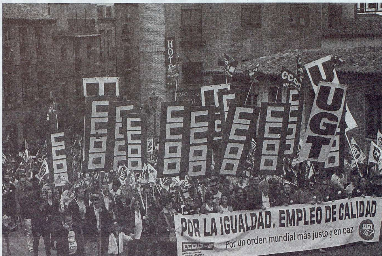
Cabecera de la manifestación del pasado 1.º de Mayo en Toledo.

En cuanto a la siniestralidad laboral , la Comisión Ejecutiva destacó la notable asistencia de delgados y delegadas al acto contra los accidentes laborales que el Sindicato realizó en Toledo el 27 de Abril en donde se reiteró la exigencia ante las Administraciones y los empresarios para el cumplimiento de la Ley de Prevención de Riesgos Laborales en