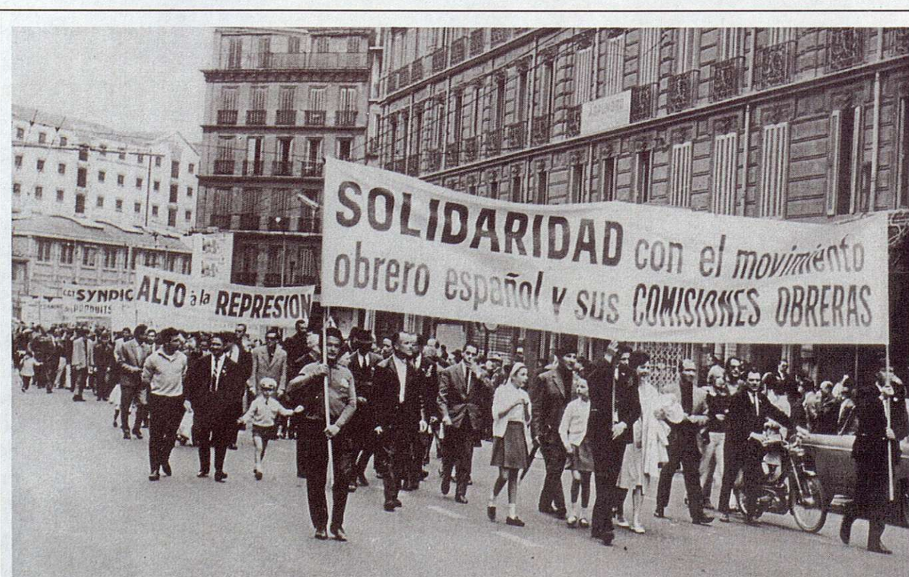
Cortejo de emigrantes portando pancartas de apoyo al movimiento obrero español en el Primero de Mayo de 1967. Marsella.

El tercer grupo da cuenta de las innovaciones que supusieron las Comisiones Obreras desde el punto de vista de la organización y la acción