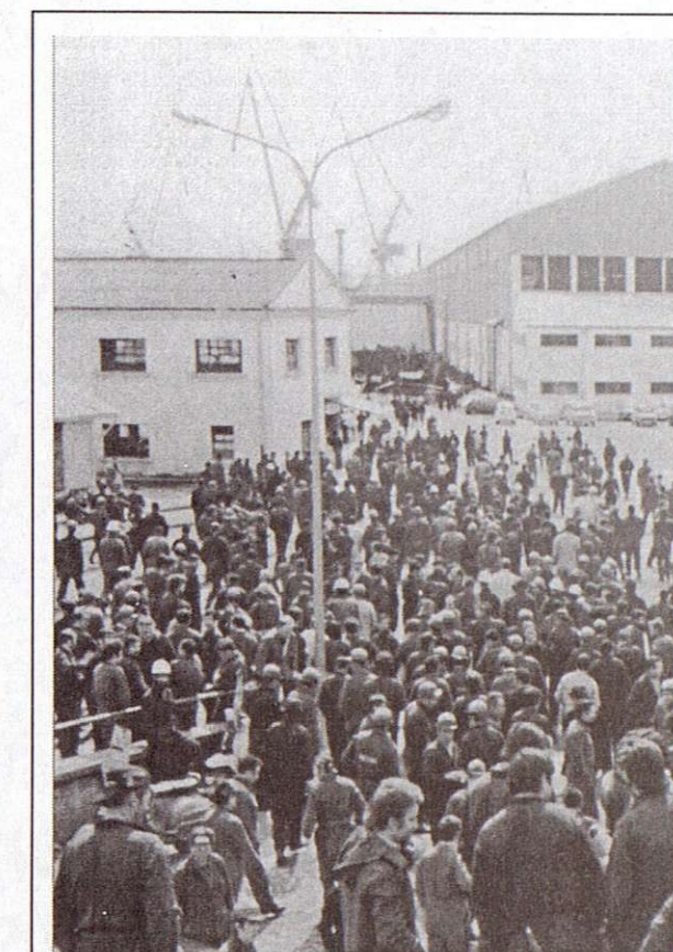
Asamblea de fábrica en los astilleros de Bazán. Ferrol, 1976

Los dos siguientes grupos de paneles reflejan dos tipos de episodios muy relacionados entre sí. Por un lado, se trata de las grandes movilizaciones del movimiento obrero. Por otro lado, se hace referencia a la represión que el franquismo desató contra Comisiones Obreras y la clase trabajadora, como respuesta a esas movilizaciones: detenciones, los crímenes de Erandio,