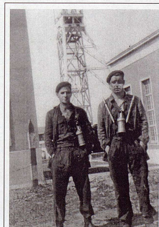
Mineros en las instalaciones de la Camocha, 1956 (Fotografía cedida por Casimiro Bayón).