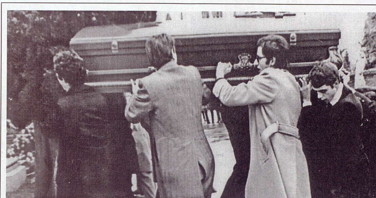
Uno de los féretros de los abogados de Atocha es transportado por varios compañeros en los funerales celebrados en la plaza de las Salesas. Madrid, enero 1977 (AHT. Fundación 1º de Mayo).

talleres, minas y tajos hasta la citada Asamblea General y la legalización del sindicato.