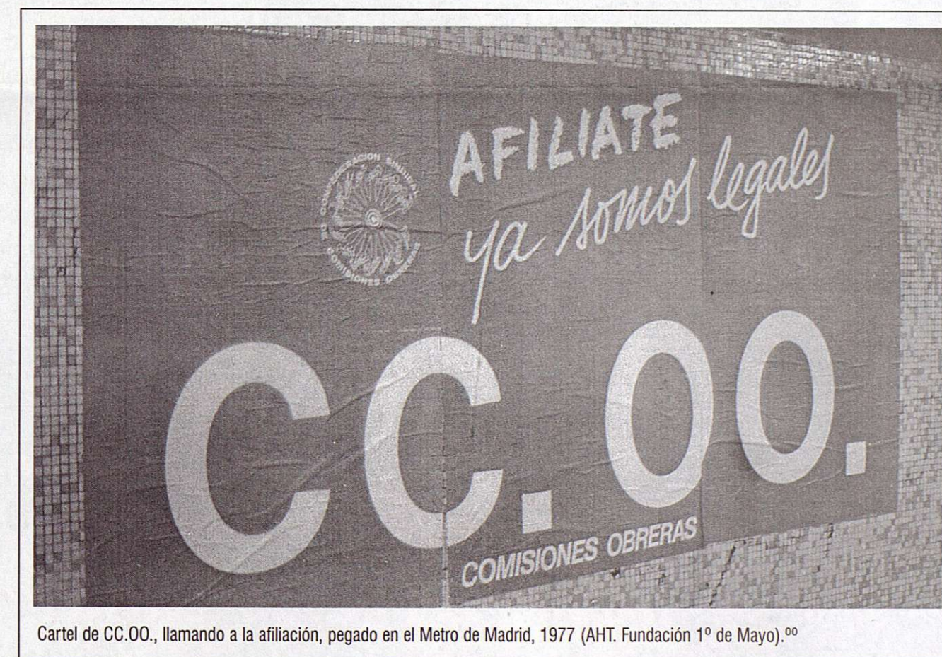
Cartel de CC.OO., llamando a la afiliación, pegado en el Metro de Madrid, 1977 (AHT. Fundación 1º de Mayo).

Granada, Ferrol, Madrid, San Adrián del Besós, Elda, Vitoria..., o el Proceso 1001 contra diez dirigentes de las Comisiones Obreras.