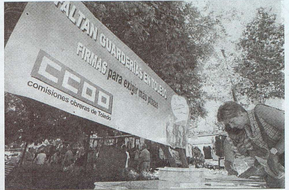
En la campaña se recogieron miles de firmas

CC.OO. valora positivamente la respuesta de la Consejería de Bienestar Social y de los alcaldes de Toledo y Talavera a este problema, considerando que las inversiones sociales, además de contener un sentido de atención al ciudadano y de justicia retributiva, aportan un importante componente añadido de creación de empleo.