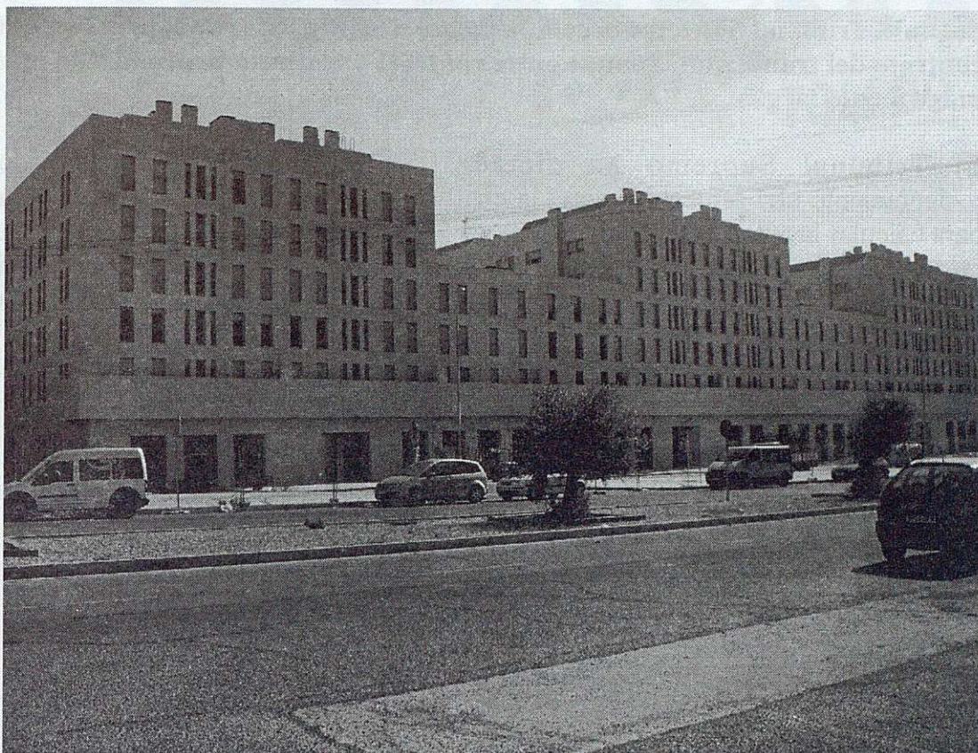
Edificio de viviendas construidas por VITRA en Toledo de próxima entrega

Desde CC.OO. consideramos absolutamente necesaria y urgente una política de vivienda decidida y audaz, de las distintas administraciones, con el Gobierno Regional al frente, que rompa con la especulación y posibilite el acceso a este bien de primerísimo necesidad a los jóvenes trabajadores.