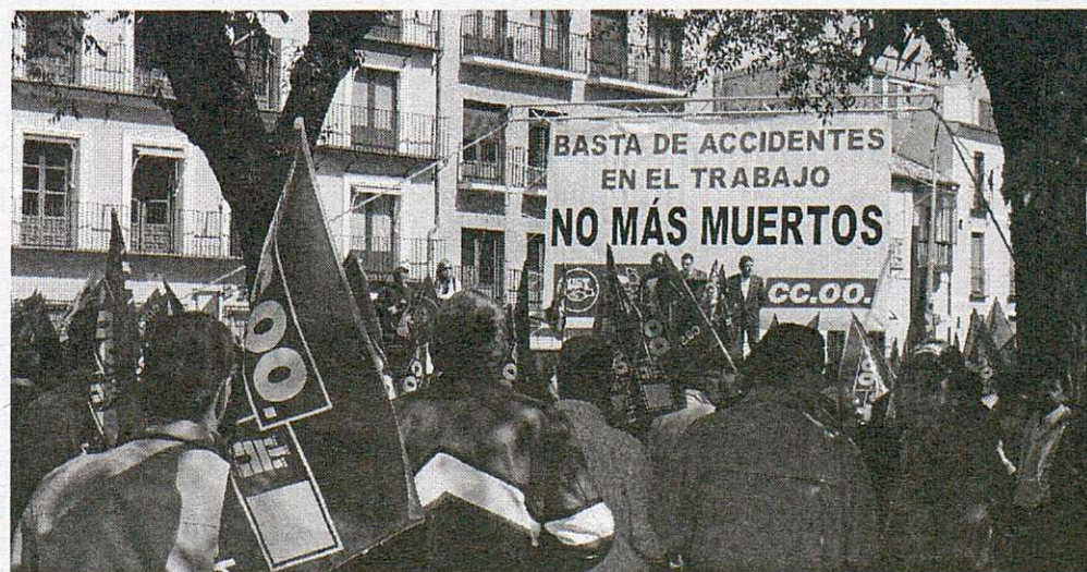
Concentración de delegados en Toledo contra los accidentes laborales

Los accidentes laborales siguen representando el problema más grave y más trágico del mercado laboral en nuestra provincia y en nuestra región. Una situación que será imposible revertir sin la implicación y asunción de su responsabilidad por parte de los empresarios y la exigencia a estos por parte de las distintas administraciones del cumplimiento de las normas de prevención, mediante la vigilancia, el control y en su caso la sanción. CC.OO. incrementará la presión y la movilización para exigir medidas más contundentes contra la siniestralidad laboral en la provincia y en la región.