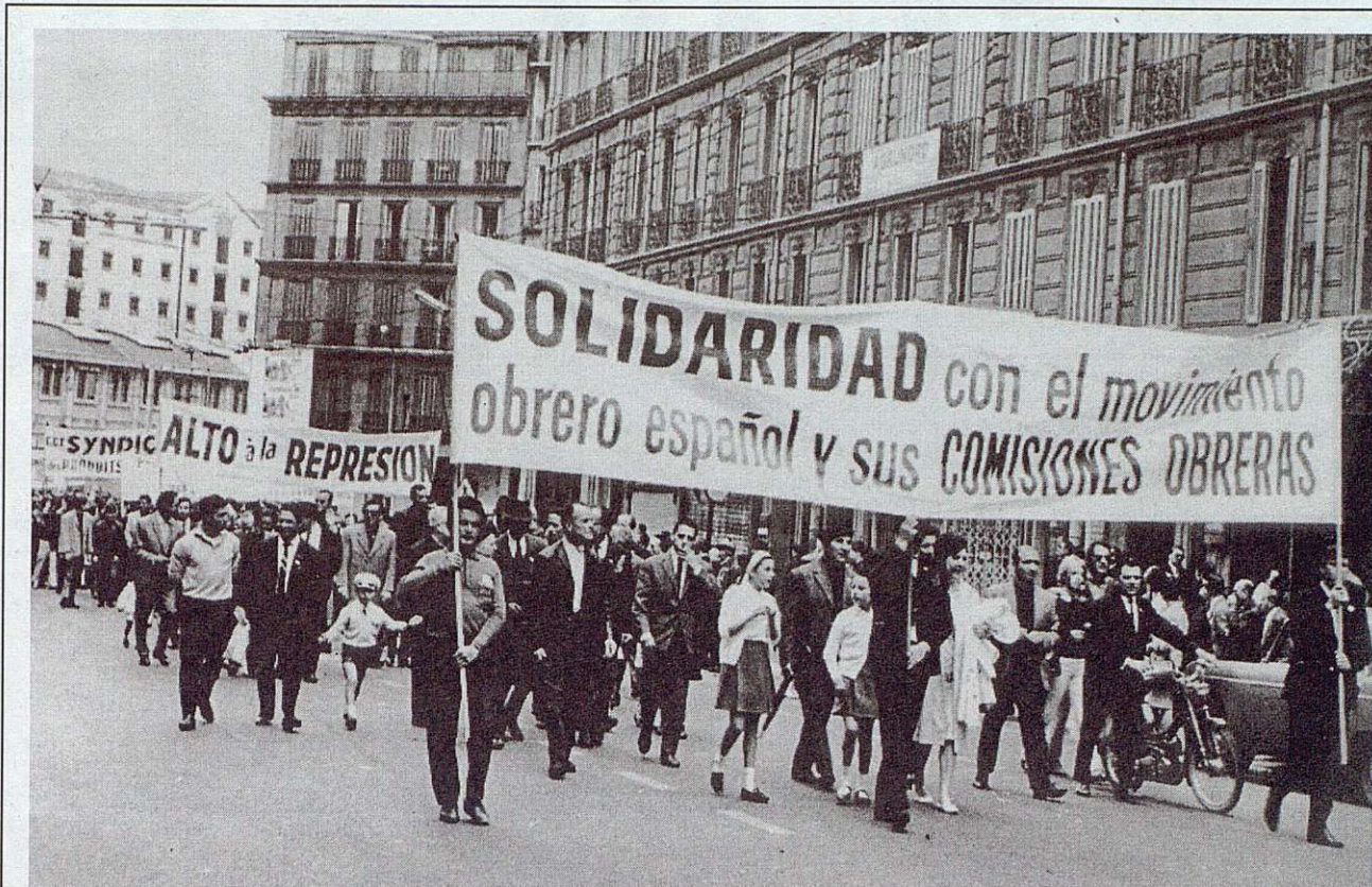
Cortejo de emigrantes portando pancartas de apoyo al movimiento obrero español en el Primero de Mayo de 1967. Marsella.

El tercer grupo da cuenta de las innovaciones que supusieron las Comisiones