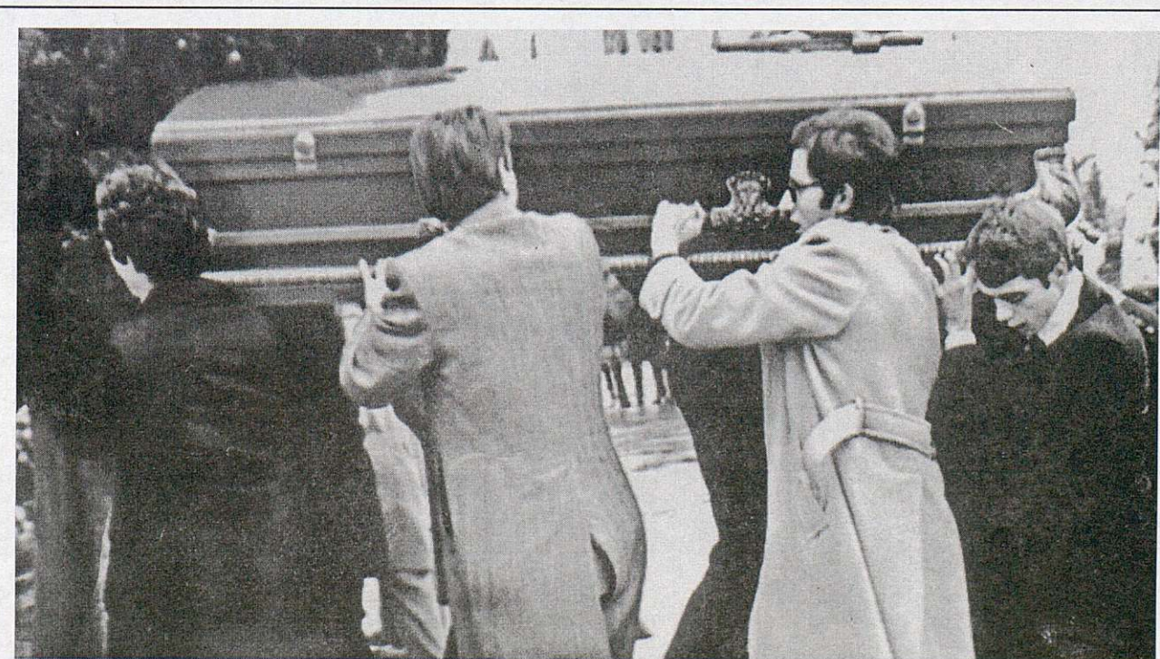
Uno de los féretros de los abogados de Atocha es transportado por varios compañeros en los funerales celebrados en la plaza de las Salesas. Madrid, enero 1977 (AHT. Fundación 1º de Mayo).