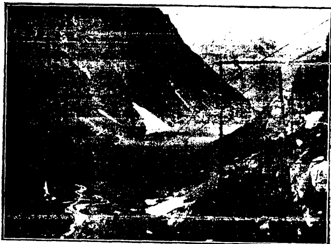
DE LA GUERRA.—Transbordador Italiano entre montañas