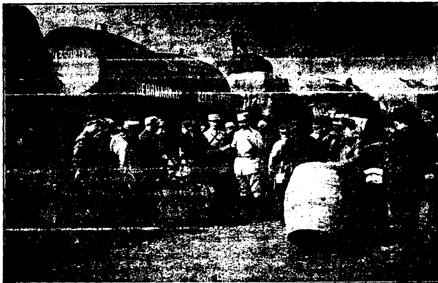
DE LA GUERRA.—Los «stock» del ejército francés.

Una necesidad que desde hace tiempo se reclamaba constantemente por los vecinos del barrio de la Estación y de la que en nuestras columnas nos hicimos eco varias veces, era el aumento de energía eléctrica en aquella parte de la población. Para solucionar estas deficiencias, debidas en gran parte a las pérdidas y variaciones del voltaje por la distancia de aquel punto a la Central y que habrían de aumentarse al empezar el funcionamiento de los futuros talleres de la «Hispano» con el mayor consumo de energía, la sociedad «Eléctrica de Guadalajara» ha solicitado la instalación de una nueva línea para conducir corriente eléctrica a alta tensión que, transformándola al voltaje adecuado, proporcione una luz intensa y clara. En la instalación habrán de colocarse grandes postes metálicos.