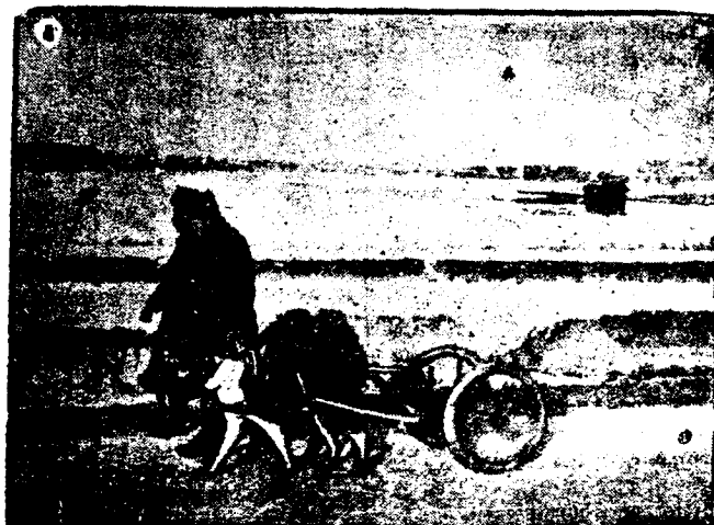
CUADROS DE LA GUERRA. Ametralladoras belgas tiradas por perros.