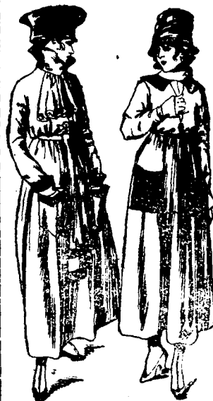
Lindos modelos de la actual temporada. (Creaciones Sabina de Beaucour).

Voy a ocuparme hoy de dos modelos muy elegantes de vestidos de tarde, que son hechos en tejidos muy claros, podrían servir para comidas íntimas.