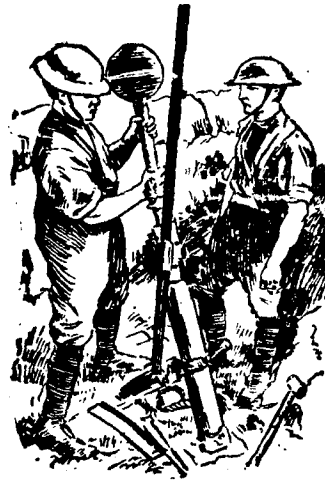
Los morteros de trinchera

Extraordinario uso se viene haciendo, en la actual conflagración, de los morteros de trinchera en los que el ejército inglés tiene puestas grandes ilusiones. Al decir de los técnicos su empleo es eficazísimo.