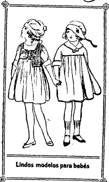
Lindos modelos para bebés

Hemos hablado de la nueva tendencia de la moda en materia de faldas, y hemos presentado algunos modelos, en que la falda tiene algún ancho hasta la mitad de su altura y luego se estrecha ligeramente hasta abajo.