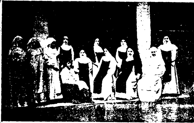
Grupo de señoritas, alumnas de la Escuela Normal, que en la noche del viernes interpretaron en el Teatro Principal, «Canción de Cuna