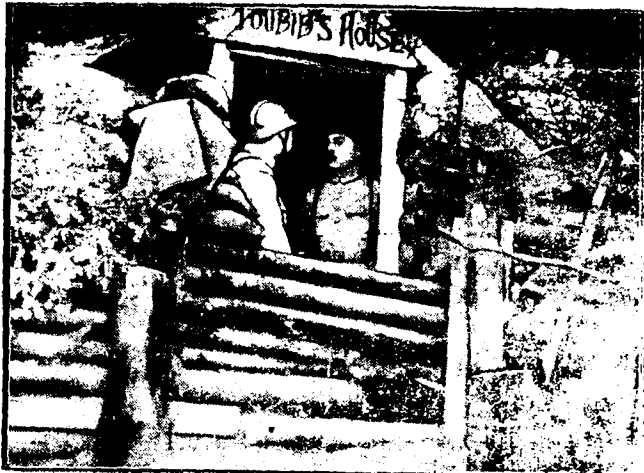
DE LA GUERRA. - La entrada de un abrigo de socorro francés