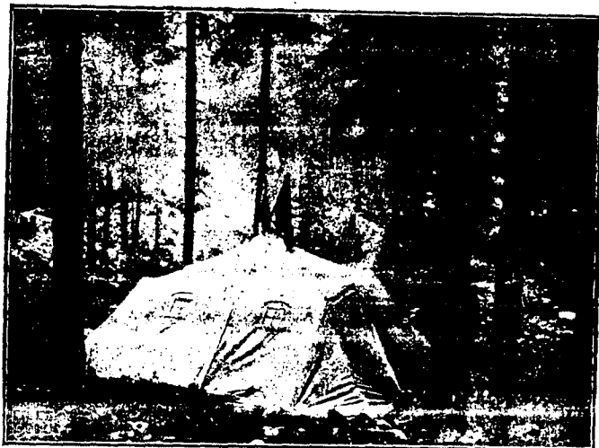
DE LA GUERRA.—Tienda de campaña del ejército italiano