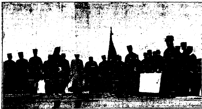
EN SAN GIORGIO DE NOGARO.—Solemne entrega de la Medalla del Valor militar a S. A. R. la duquesa de Aosta, inspectora general de la Cruz Roja Italiana.