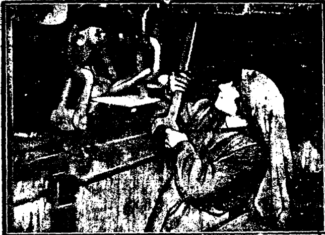
POR LA GUERRA. —Mujer trabajando en el Metropolitano de París