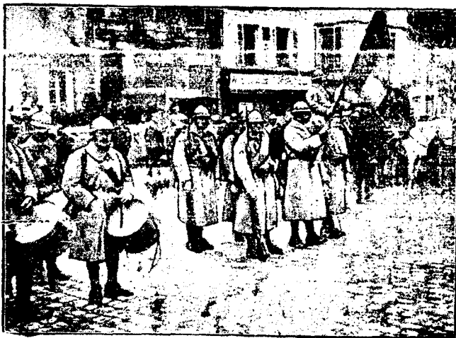
DE LA GUERRA.— Tropas francesas en la Plaza de Noyón.

Se constituirá una gran familia liberal, fuertemente unida, ligada por afectos y hermanada por ideales donde no quepan odios, ni enconos, ni recelos, ni intrigas de baja política.