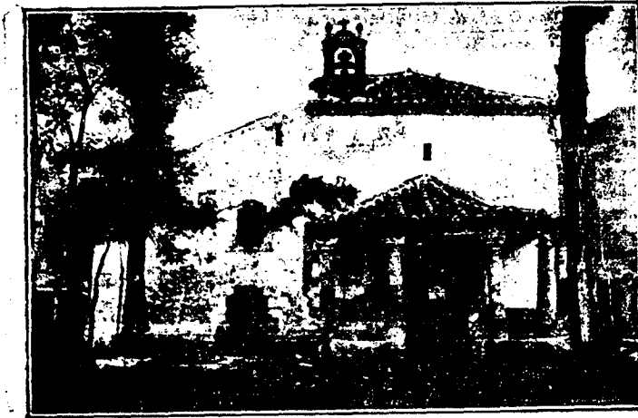
Ermita de Santa Librada donde se celebra la fiesta el día 1.º de agosto