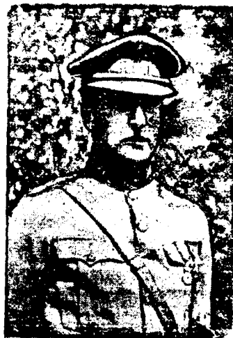
El rey Alberto, de Bélgica

a quien los reyes de Inglaterra han visitado en homenaje al aniversario de la heroica resistencia que opusieron a las tropas alemanas.