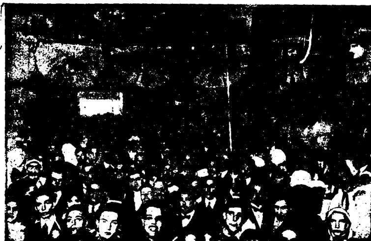
Aspecto que ofrecía la sala del Teatro Principal en la noche del domingo de Piñata