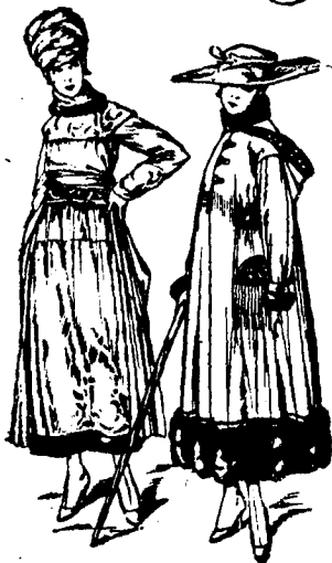
Últimos modelos de la temporada