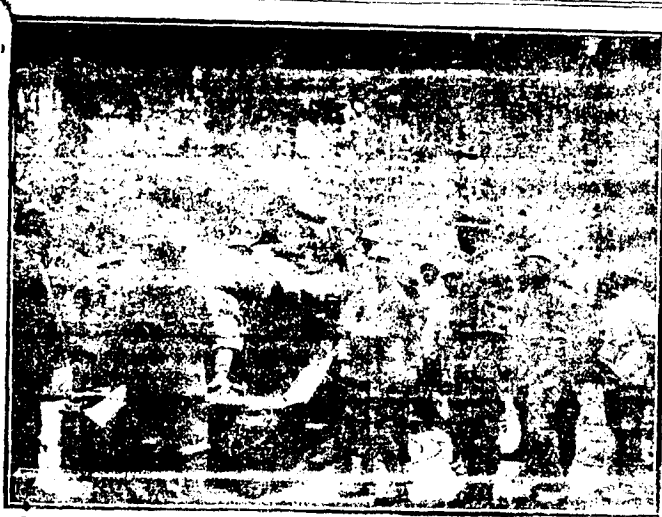
DE LA GUERRA.—Cargando un cañón de grueso calibre, en la defensa italiana

Tenemos fé en los destinos de España. Lo hemos dicho muchas veces en estos últimos seis meses, y en estas mismas columnas, donde vamos registrando este movimiento de evolución rápida y constante en el que se ve el imperio de la idea sobre el grosero materialismo. ¿Quién duda que en España, como en todas partes, se impondrán al fin las mejores, las más entes, los más puros y quizá los más ignorados, y serán ministros los hombres desconocidos? Estos hombres sepultarán pa-