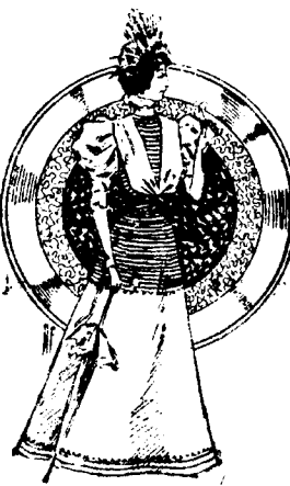
Otro traje para paseo.

De seda glasé, cuerpo ajustado y abrochado al lado; volante de mismo género y otro de gasa plegada, recogido con botones en el delantero. Cuello de gasa; mangas al biés y talda en forma de campana, adornada con dos volantes del mismo género.