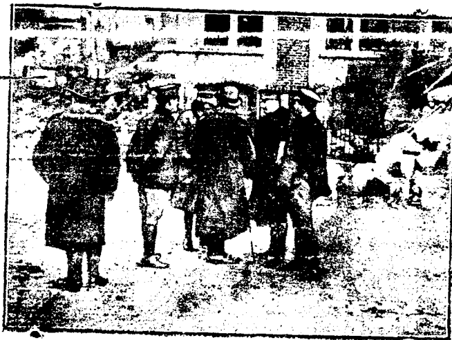
DE LA GUERRA. — Oficiales militares españoles en formación.

Y terminamos estas notas rápidas expresando nuestra gratitud por las atenciones y agasajos de que fuimos objeto. Cuenca nos acogió con toda hospitalidad y generosidad.