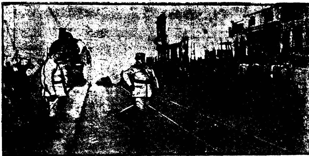
DE LA GUERRA.—Tropas destilando en los muelles de Salonica