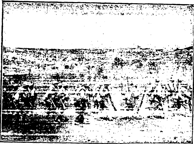
DE LA GUERRA - Columna de infantería del ejército italiano.