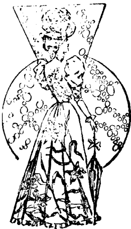
Traje para passo

Se llevan mucho las muselinas las puntillas, la gasa, el lien y todo lo que sea agradable á la vista por su sencillez.