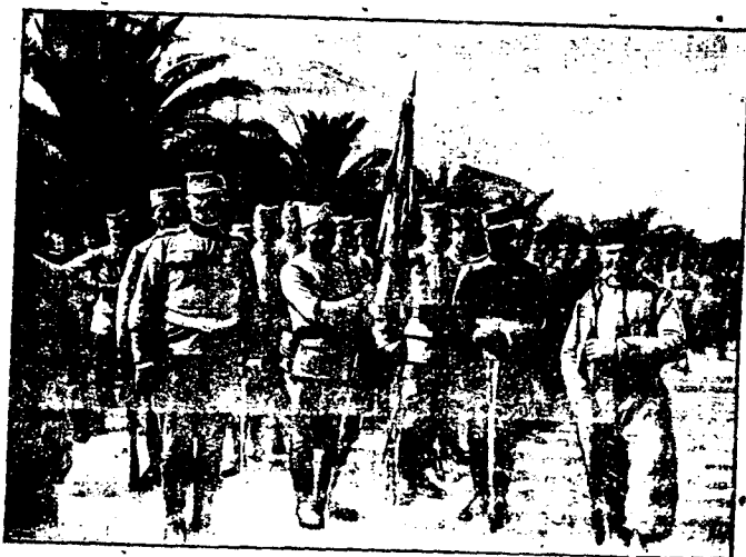
DEL EJERCITO SERVIO. Durante la pasada semana se han tributado homenajes extraordinarios a la bandera serbia y al anciano soberano cuyo retrato publicamos en otro lugar