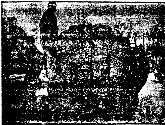
DE LA GUERRA. - Un tanque haciendo reparaciones