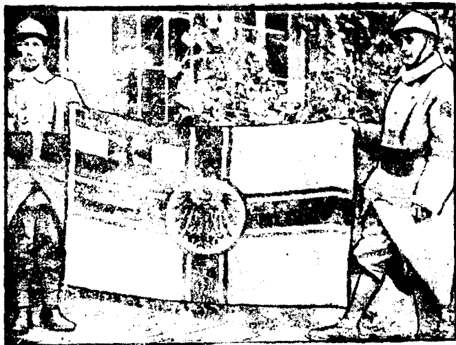
DE LA GUERRA.—Bandera alemana conquistada por las tropas francesas.