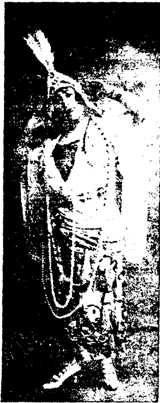
La hermosa tiple LOLA VELA, de la compañía Videgain, en "El asombro de Damasco,"

Debemos anotar que es abusivo lo que todos los años sucede con algunos profesionales de la mendicidad que se sitúan en el camino de la Plaza de toros. Se sabe hasta la saciedad que estos mendigos se niegan a ingresar en los asilos y hospitales, porque la men-