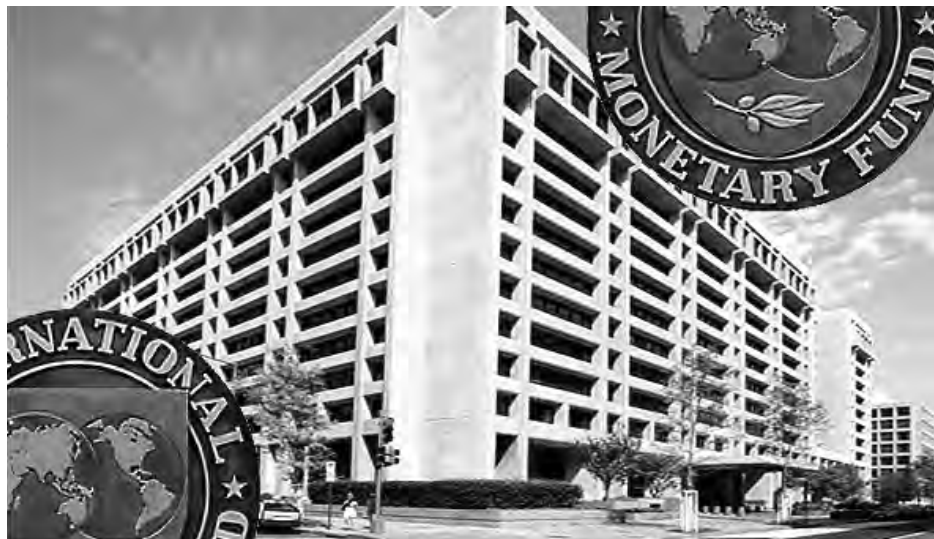
El FMI ve como la economía española, poco a poco, se va recuperando.

Son las estimaciones del FMI, ha advertido de que un incremento de los desequilibrios económicos en algunos países, en los que la recuperación coincide con un elevado desempleo