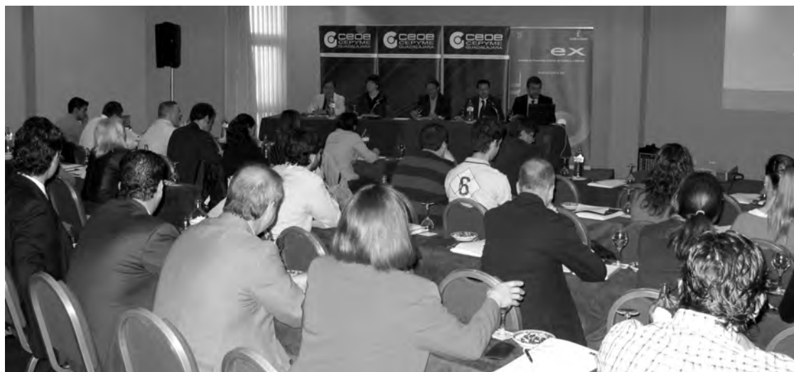
Las jornadas de comercio exterior siempre son muy bien acogidas por los empresarios y emprendedores.

Las importaciones lo hacen en un 460% de enero a noviembre de 2010. Siendo la cuarta provincia que más ha crecido su nivel exportador, pasando de 48.586 miles de euros en enero a 57.465 miles de euros en noviembre de 2010