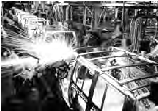
Son una de las bases para el crecimiento.

También contribuyeron al crecimiento interanual de los precios industriales los bienes intermedios, cuya variación anual aumentó seis décimas, hasta el 5,7%, su mayor tasa desde septiembre de 2008.