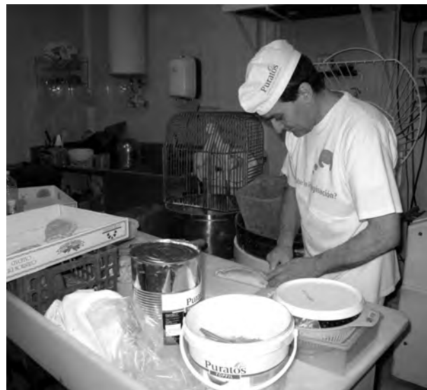
Tanto el pan como los bollos se hacen artesanalmente.

notado un poco el bajón, sobre todo “porque ahora venden pan en todos los sitios”, a lo que sigue diciendo “y el precio suele ser más bajo, aunque también baja la calidad”. Así, su arma, que les hace seguir en el negocio es “lo que trabajamos es la calidad y el buen producto, pero sobre todo, el pan recién hecho”, argumenta este panadero. Establecimiento en el que además se puede encontrar, todo casero y recién sacado del horno, magdalenas, roscon de reyes, bizcochos, con diferentes rellenos, tortas de anís o de huevo, entre otros productos, todos como afirma la propietaria “hechos a mano. A los clientes que no se lo creen les decimos que se asomen para que puedan ver como se hace el pan a mano”. Una manera diferente de ver el pan y darle vida a un establecimiento de Guadalajara que ha sabido como ganarse, por el estómago y la vista, a sus clientes.