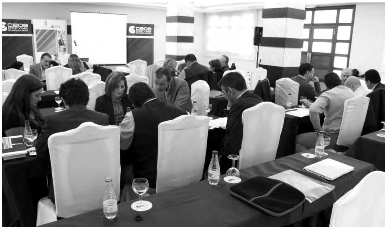
Los asistentes hicieron prácticas de lo que previamente habían explicado los ponentes.

Una jornada que resultó muy dinámica para saber actuar ante una crisis. La elaboración de un comunicado y cómo expresarlo y harlo llegar a los medios de comunicación han centrado la temática de la exposición