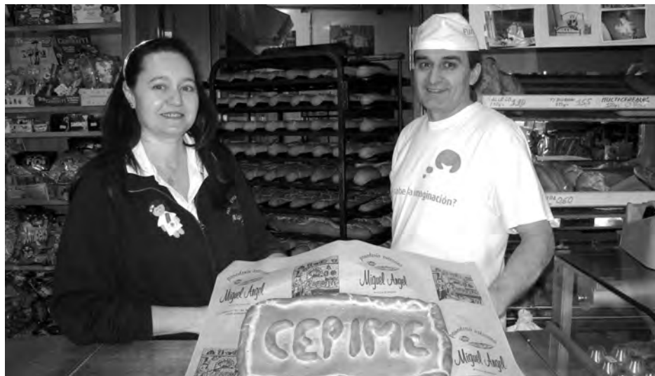
Los dueños del establecimiento con uno de los panes que han realizado.