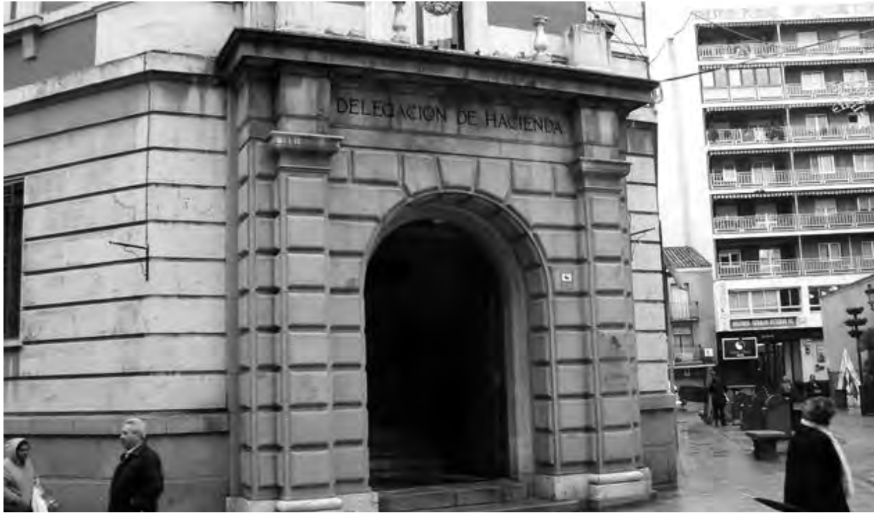
Las empresas podrán solicitar la devolución del IVA de aquellas facturas que no han cobrado.

Esta cuestión afecta de lleno a las empresas, que se ven obligadas a ingresar las cuotas de IVA repercutidas a los entes públicos a pesar de no haberlas cobrado. Ahora podrán reclamar este dinero