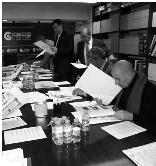
Los miembros del jurado abrieron los proyectos.

Después de cada una de las exposiciones, en referencia a cada proyecto, por cada miembro del jurado, se ha hecho un proceso de selección donde han quedado finalistas tres proyectos denominados, Leed,