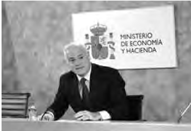
El secretario de Estado durante su intervención.