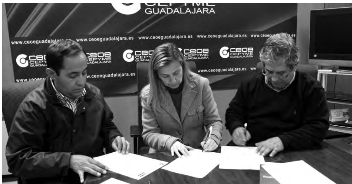
Un ahorro en carburante del que se pueden beneficiar los 19.000 titulares de la tarjeta de CEOE-CEPYME Guadalajara.