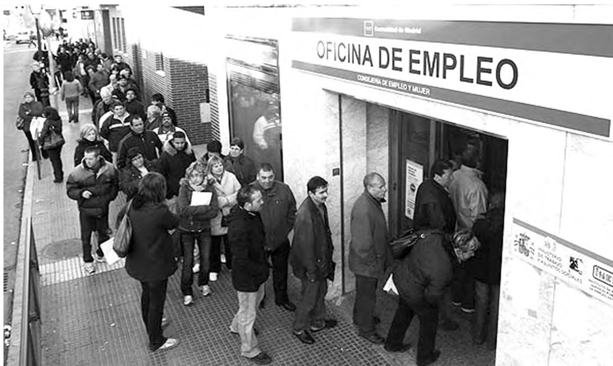
El mercado laboral no puede hacer frente a tanta demanda de búsqueda de empleo.