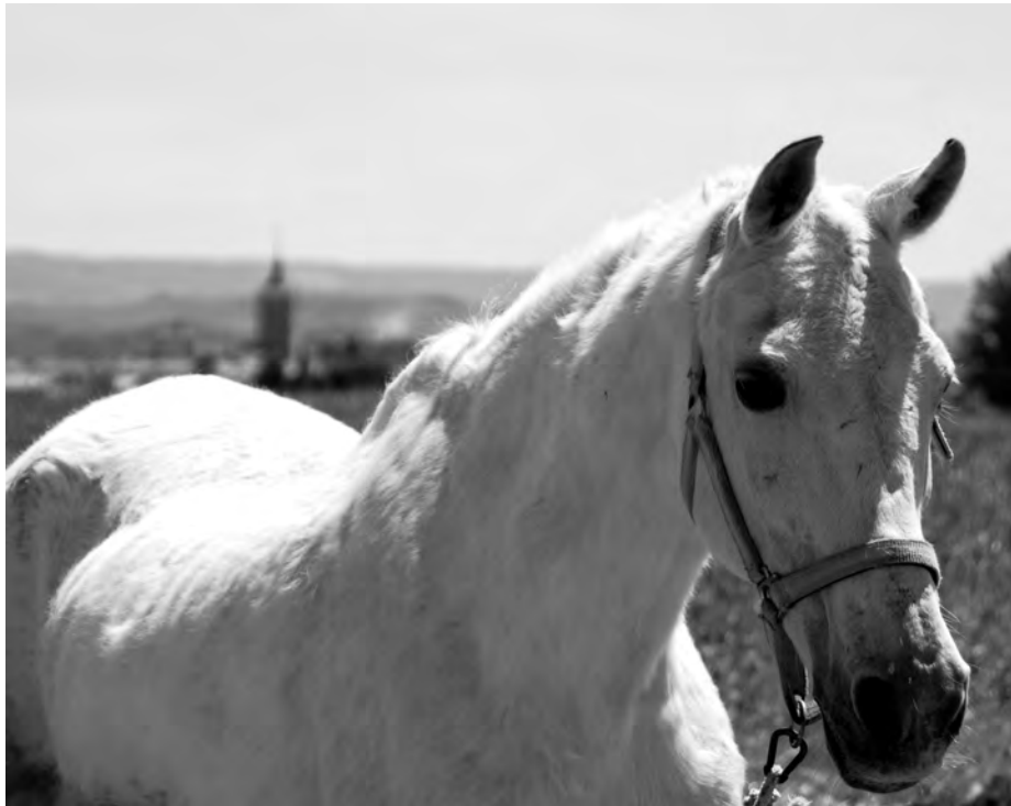
El caballo será el centro de la feria de Yunquera./Economía de Guadalajara

Se va a desarrollar en Yunquera de Henares entre el 11 y 13 de junio y versará en torno al mundo del caballo, un ocio y un mercado en auge en la provincia de Guadalajara. El proyecto está apoyado por la Diputación, CEOE y APAG, entre otras instituciones