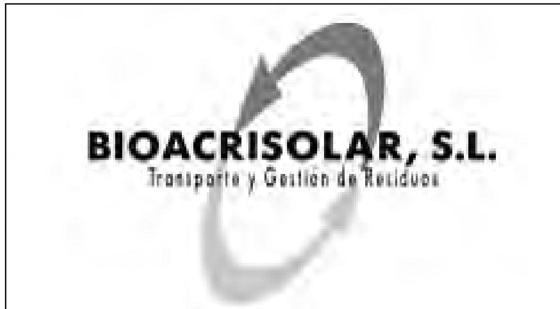
La empresa gestiona los residuos de las empresas para las que trabaja.

En Bioacrisolar el principal compromiso, como compañía dedicada a la Gestión de residuos para