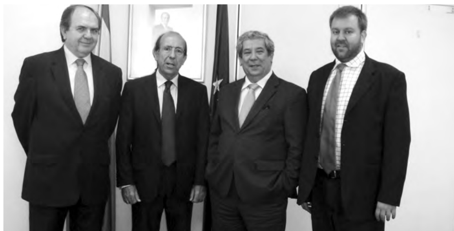
Se tuvieron encuentros con los agregados comerciales de los diferentes países visitados./ Economía de Guadalajara