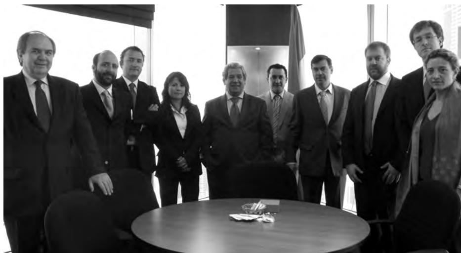
Parte de la expedición castellano-manchega en una de las reuniones mantenidas./ Economía de Guadalajara

Las misiones comerciales y visitas a ferias internacionales con un recurso más con el que cuentan las empresas de la provincia de Guadalajara para buscar otros nichos de mercado y potenciales clientes en el exterior