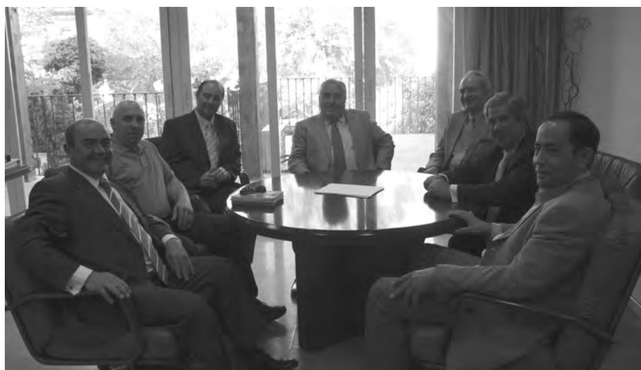
El presidente de CEOE-CEPYME Guadalajara se reúne con parte de la Junta Directiva de la Cámara.