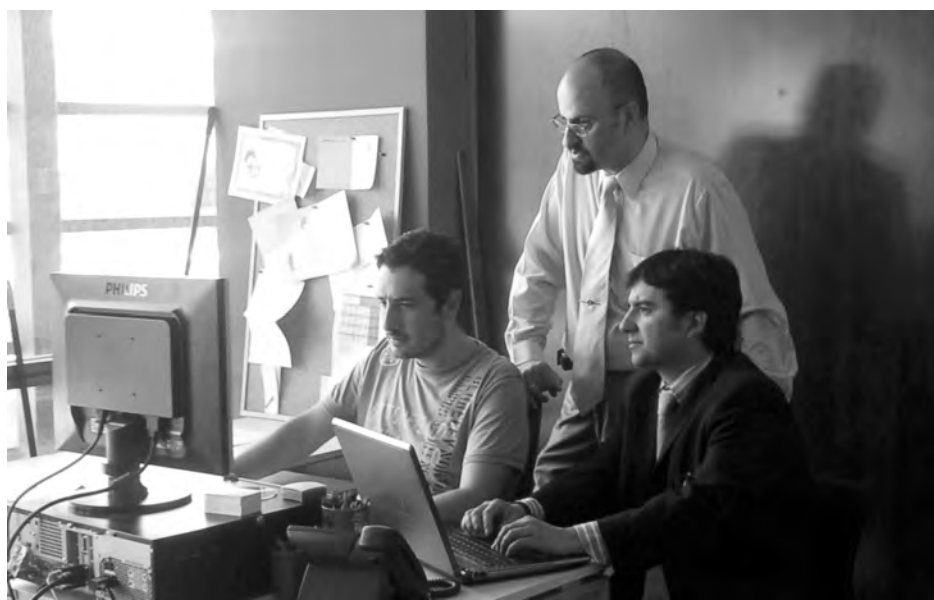
Los socios han visto en el Centro de Empresas una gran oportunidad de negocio./ Economía de Guadalajara

En 2008, montaron una empresa dedicada tanto a la consultoría tradicional en gestión como a consultoría tecnológica aplicada. Se considera que la idea es realmente interesante para las empresas por el ahorro de tiempo que les supone