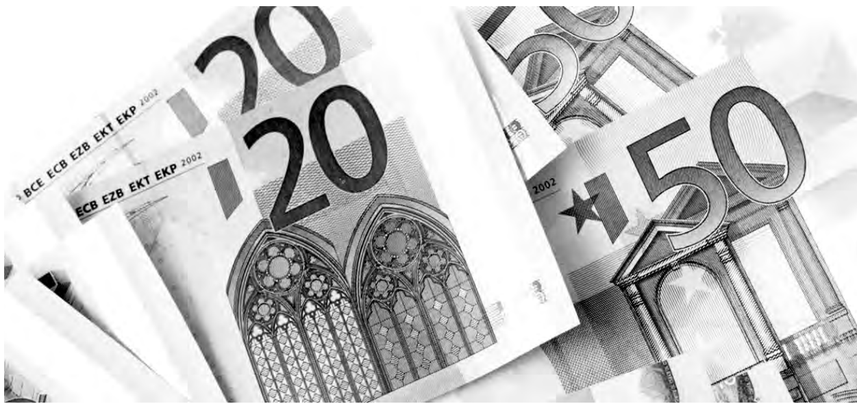
El proceso de recuperación económica en España se van empezando a apreciar poco a poco.