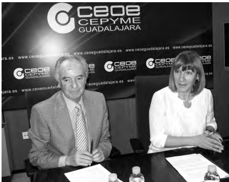
El presidente de CEOE y la consejera de Educación, presidieron la reunión./ Marta Sanz