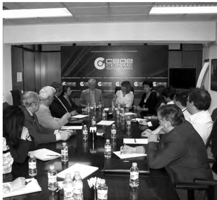
Los empresarios estuvieron atentos a todas las explicaciones./ Marta Sanz

Tecnológicos de Albacete y Guadalajara, de los centros tecnológicos existentes e impulsando otros nuevos a demanda de sectores empresariales muy activos, como el metal y el asfalto.