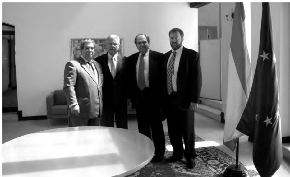
Una de las reuniones fue con el Embajador de España en Qatar./ Economía de Guadalajara