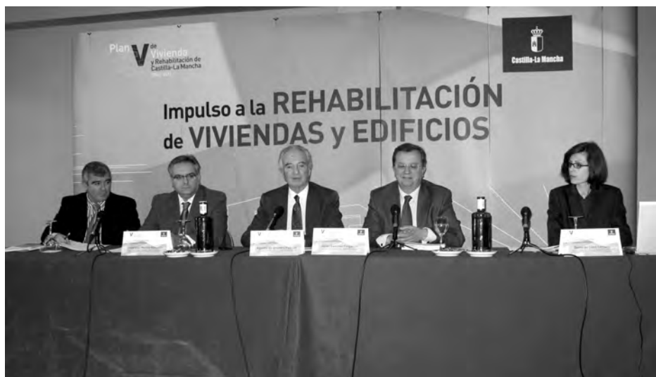
El presidente de CEOE-CEPYME Guadalajara y el consejero de Ordenación presidieron la reunión.