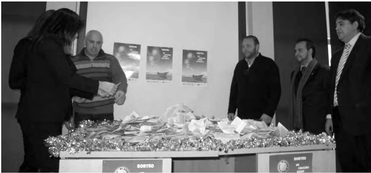
Los presidentes de las Federaciones de Comercio y Turismo de CEOE, participaron en la campaña del / Marta Sanz