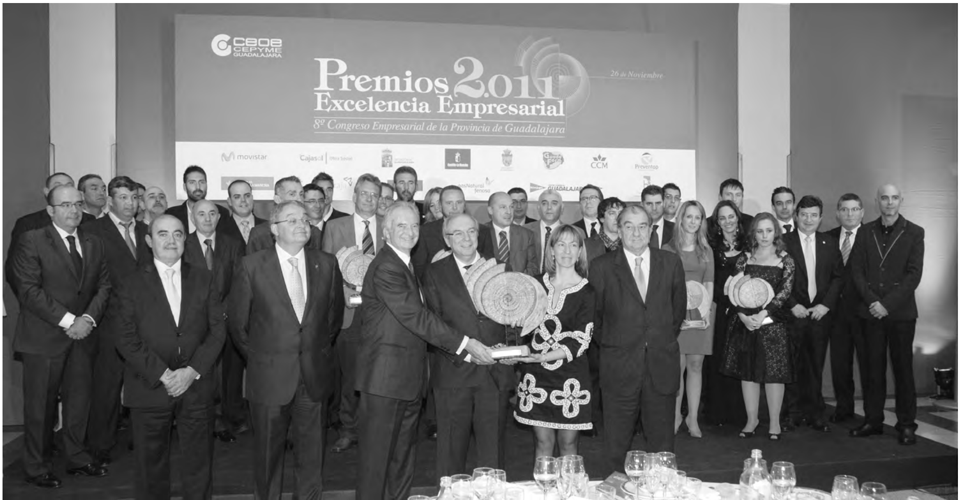
Foto de familia de todos los premiados con los patrocinadores de los Premios Excelencia Empresarial 2011.