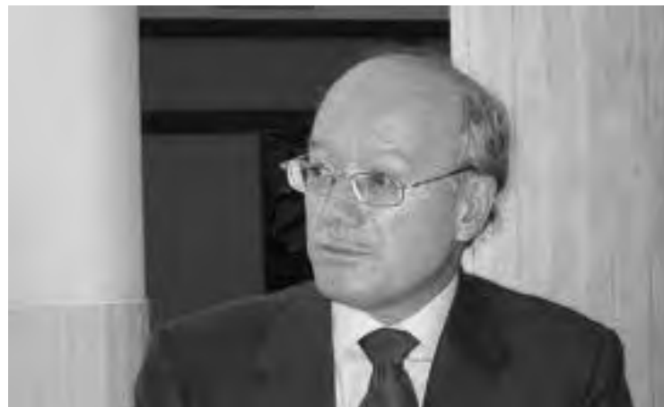
Feito también es asesor económico de CEOE.

Además, ha pedido "profesionalidad" en los órganos reguladores, y ha insistido en su reorganización para así ganar "eficiencia" y reducir costes de personal y ubicación. "Todas las autoridades deberían hacer un esfuerzo para reducir las barreras de entrada porque harán que el mercado funcione más eficientemente", ha concluido.