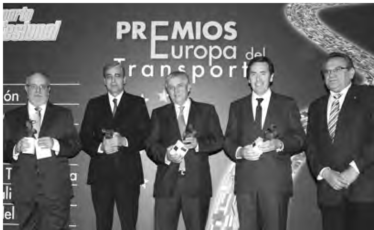
Los consejeros delegados de Gran Europa y Transportes Sedano, con su premio intermodalidad.