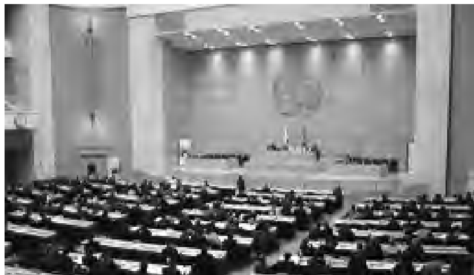
La ONU considera que los fondos de rescate son limitados / Economía de Guadalajara

El "talón de Aquiles" de la economía mundial es la continuada crisis de empleo. Uno de los aspectos que habrá que recuperar si se quiere lograr la estabilidad económica