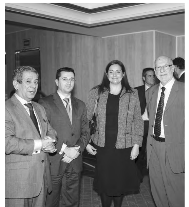
Empresarios alcarreños arrojaron a los premiados