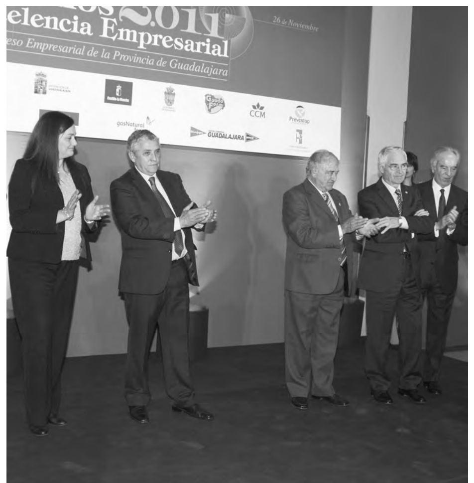
Los premiados a nivel nacional e internacional recibieron su homenaje en la "noche de la economía alcarreña".