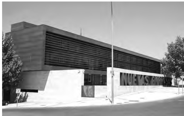
El Centro de empresas está abierto a todos los emprendedores.

dor podrá disfrutar de apoyo técnico en la tramitación para la creación y constitución de empresas, dado que el CEEI Guadalajara es miembro de la Red de Puntos de Tramitación Empresarial (PAIT). Actualmente, el emprendedor puede crear su empresa en el CEEI para tres formas jurídicas, en tan sólo 48 horas: Sociedad de Responsabilidad Limitada (SL o SRL), Sociedad Limitada de Nueva