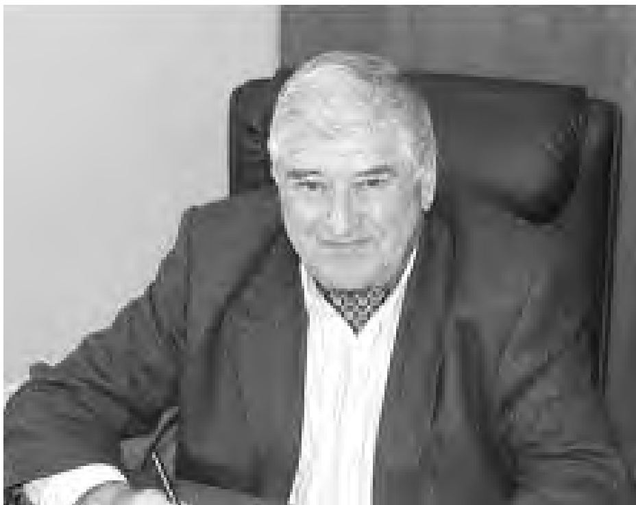
García Moya ha creado cinco empresas en un conglomerado que ahora gestionan sus hijos y sobrinos.

El empresario asegura que si volviera atrás arriesgaría más de lo que lo hizo en su momento en los negocios. Orgullosos, ahora, de que sean sus hijos y sobrinos los que llevan las riendas del conglomerado de empresas que él mismo fundó