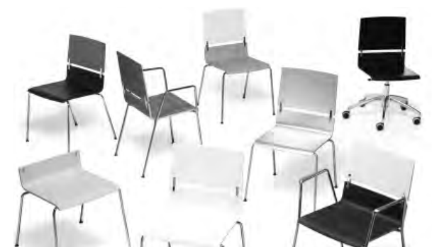
Mesas y sillas son algunos de los productos de Tagar.