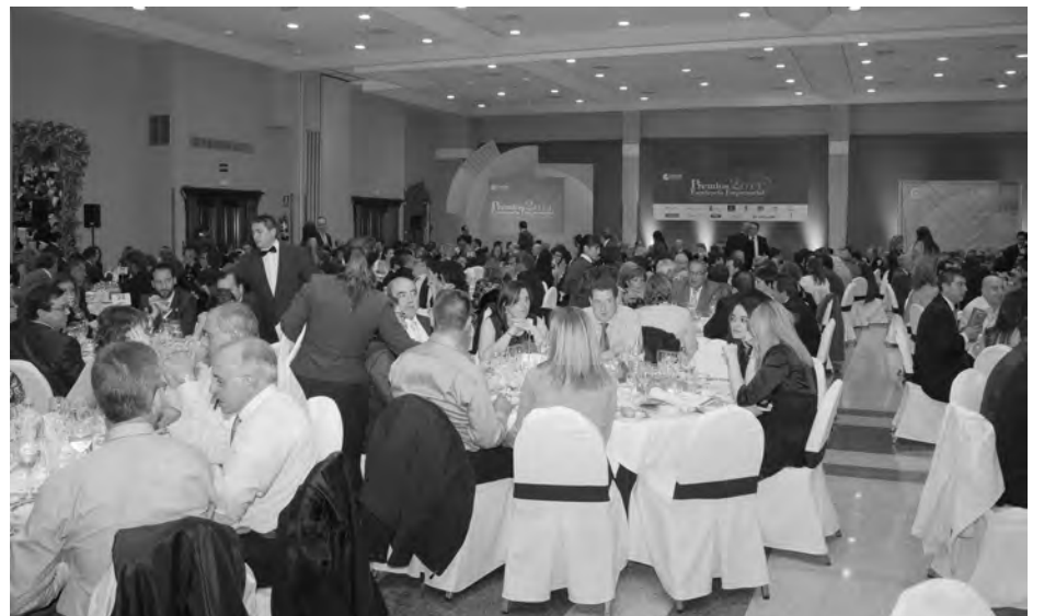
400 asistentes disfrutaron de una agradable velada tras la entrega de premios.