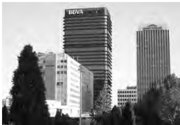
Sede de la entidad financiera en Madrid.

"Más importante aún puede ser el efecto que las preocupaciones por la sol-