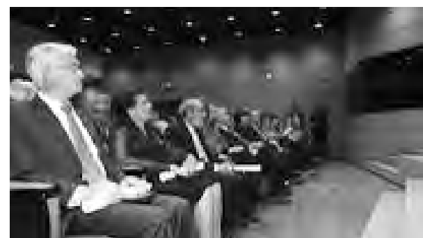
En la ceremonia estuvo acompañado por su familia.

Un empresario, que no sólo ha vivido para sus empresas, sino que ha sido responsable de asociaciones y federaciones a nivel nacional, quitando tiempo de sus propios negocios y de estar con sus hijos, pero cargos que le sirvieron para conocer el sector y ayudarlo a mejorar, así vicepresidente de la Federación Española de Pavimentos de Madera (FEPM) y socio fundador desde 1995, Presidente de la Asociación de Investigación Técnica de las Industrias de la Madera y Corcho (AITIM), o presidente de la Federación Española de Industrias de la Madera (FEIM) y de la Asociación Nacional de Fabricantes de Parquet (ANFP), durante 20 años, han sido alguno de ellos, que se complementan con los premios recibidos, tanto a sus empresas como a su persona como, primero emprendedor y luego empresario, reconocen el valor de un empresario hecho a sí mismo.