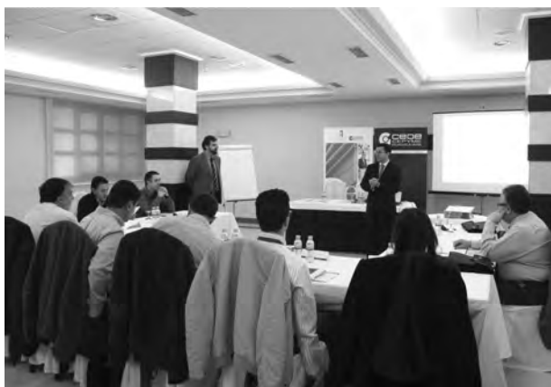
Los grupos de trabajo reducidos han sido la tónica de los cursos./M.S.M.

Para lograr todo esto, de la Paz se sirvió de conceptos como el contacto con la realidad, los planes de acción, es decir, qué quiero