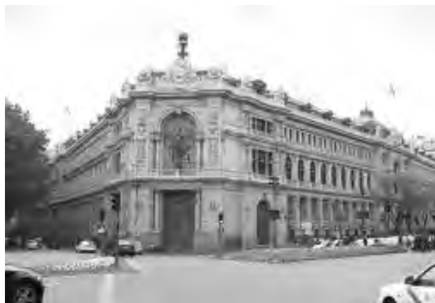
El BE considera que algunas entidades necesitarán más capital/ E. de G.

En este sentido, destacó que los requisitos serán "proporcionales" al "grado de sistemicidad" de la entidad, lo cual podría elevar sustancialmente el nivel exigido en algunos casos, según explicó durante su intervención en la III Jornada de Actualidad Financiera de la Unión Europea organizada por CECA y Funcas.