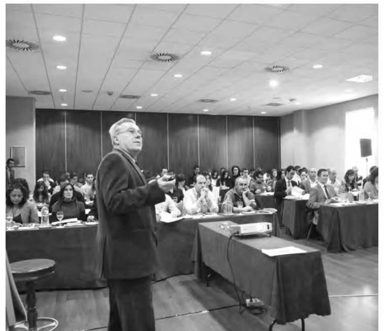
Los emprendedores aprendieron sobre comercio exterior./ Marta Sanz