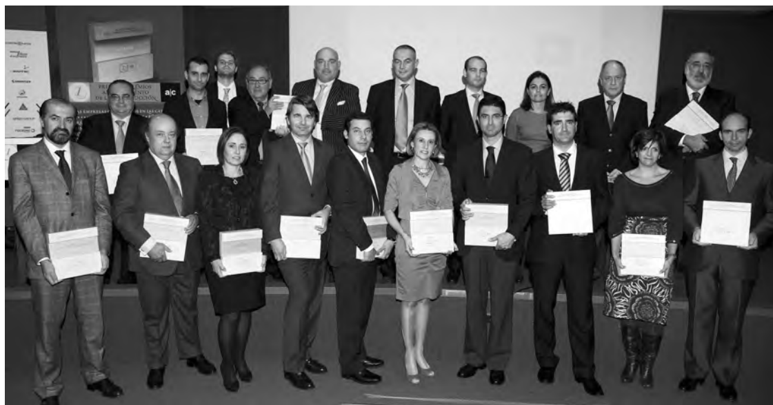
Foto de familia de todas las empresas galardonadas.

Los conceptos tenidos en cuenta por los votantes, han sido, entre otras cosas, la calidad, la innovación, el servicio, la atención técnica y sobre todo, el valor añadido que la empresa es capaz de ofrecer al usuario final.