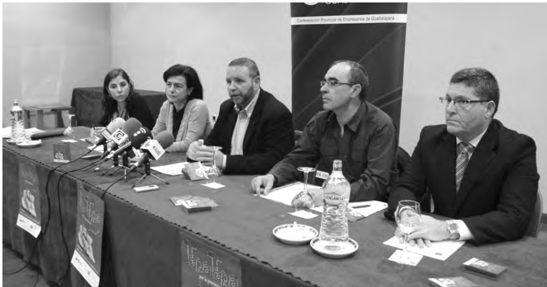
Momento de la presentación de la ruta de la tapa por la provincia de Guadalajara 2011.