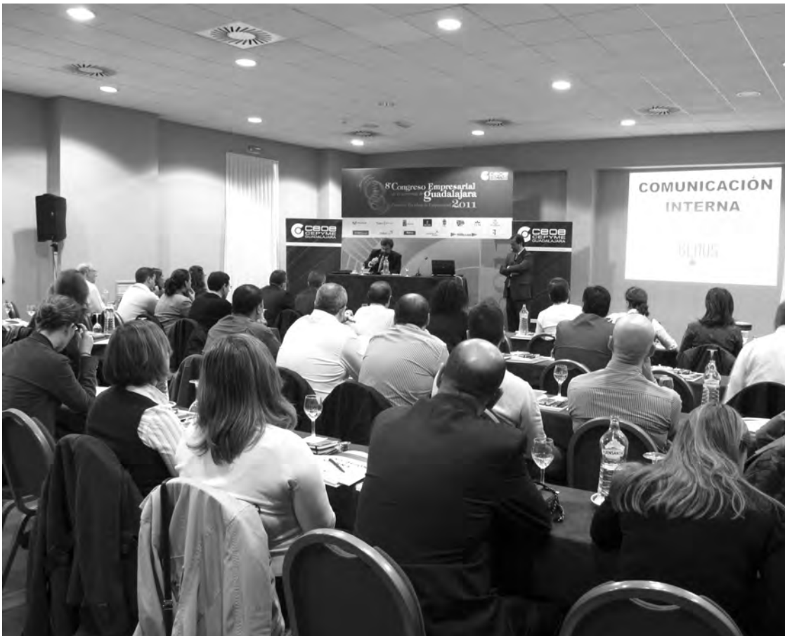
La comunicación interna y el papel del mando intermedio fue de lo que más llamó la atención que llenaron el salón./ M.S.M.