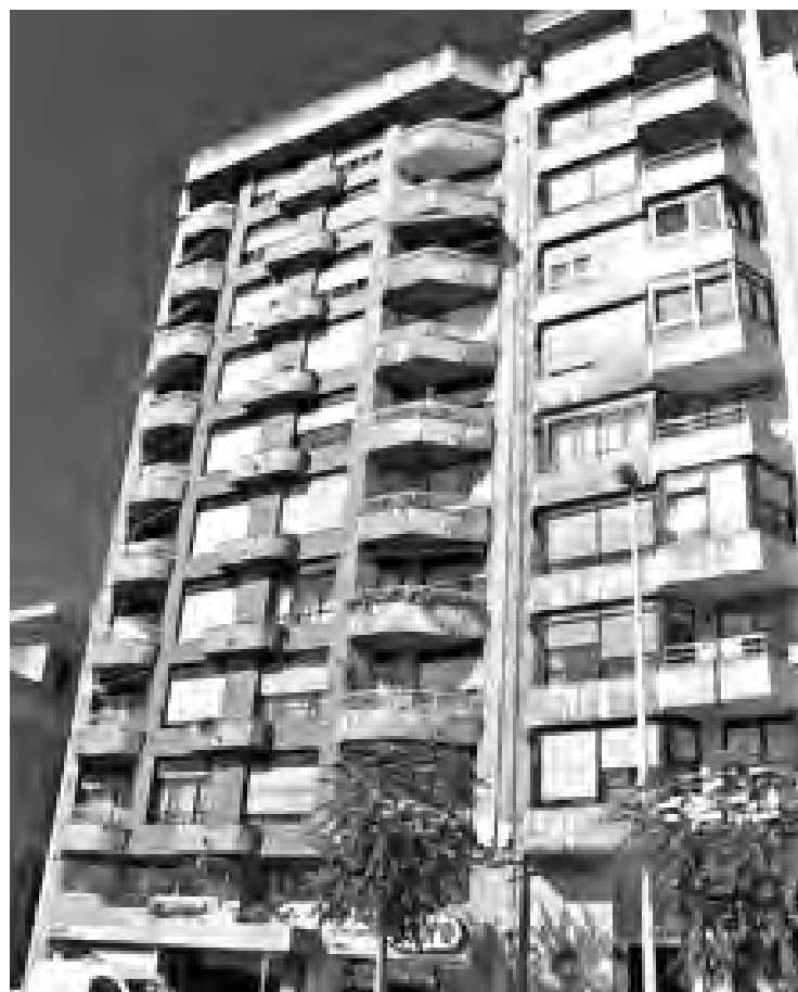
Los hipotecados deberán pagar más a partir de este mes./ Economía de Guadalajara

Con estos niveles, las hipotecas medias de 120.000 euros a 20 años a las que les toque revisión en julio sufrirán una subida de la cuota mensual de 46,77 euros.