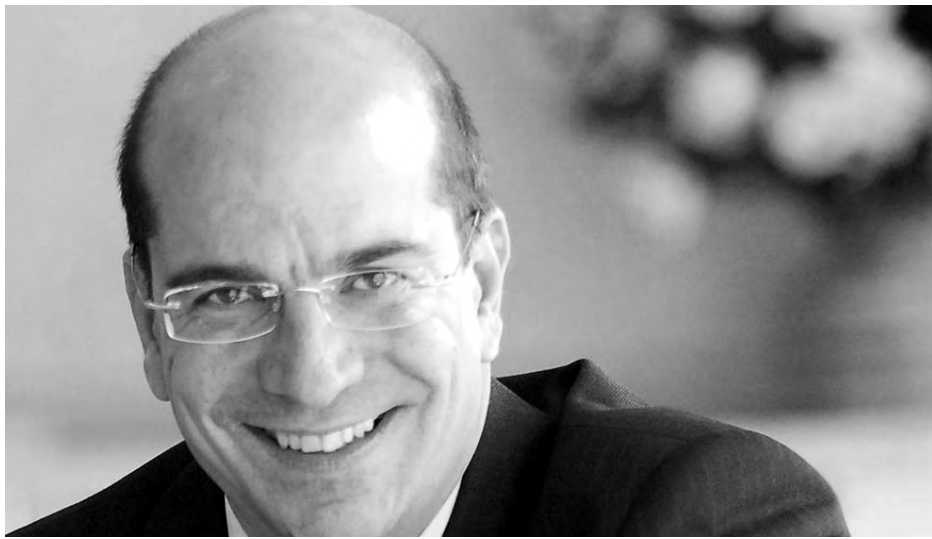
Su dilatada experiencia facilitará la relación con las nuevas empresas. / Economía de Guadalajara