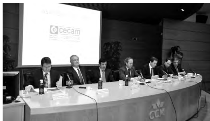
El cobrar las deudas seguía un balón de oxígeno para las empresas.