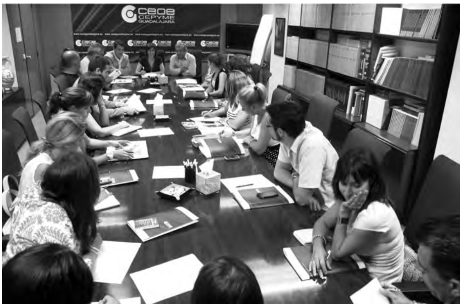
Una decena de empresarios del sector de las guarderías han acudido a la reunión.

EL DATO El crear una guardería pública puede llegar a costar hasta 18.000 euros por plaza, incluyendo su construcción y el gasto en equipamiento. Por su parte la creación de esta de titularidad privada, supone un coste total de 6.000 euros por plaza de guardería