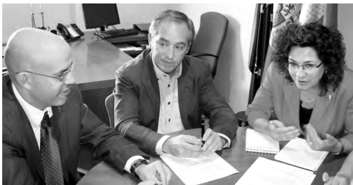
Los empresarios abogan por la llegada de ayudas para salvar el sector.