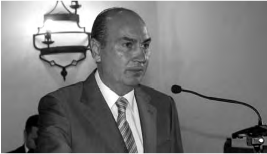
Aunar criterios para la promoción turística será una de sus primeras acciones.