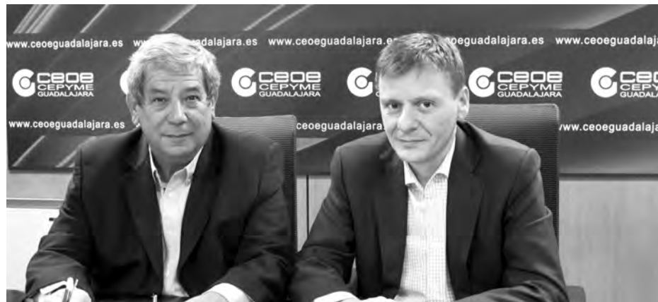
El número de equipos es limitado y se dará a los primeros que lo soliciten.

A través de este sistema de comunicación vía satélite, que ya se probó en su momento, pero que los avances tecnológicos permiten ahora una conexión con mayores garantías, se puede acceder, en unas condiciones muy baratas, de merca-