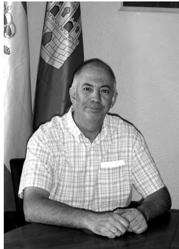
Aunar las dos Guadalajaras será otro de sus retos.

Domínguez, además, compaginará sus quehaceres políticos seguirá con su trabajo como industrial y gerente de sus empresas.