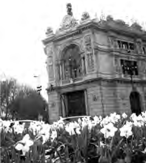
Han descendido los créditos a corto plazo.

Asimismo, los activos financieros se situaron entre enero y marzo en 1,78 billones de euros, 2,1% por encima del saldo del primer trimestre de 2010. Del total, 858.868 millones correspondían a dinero en efectivo y depósitos, que crecieron un 3,9%.