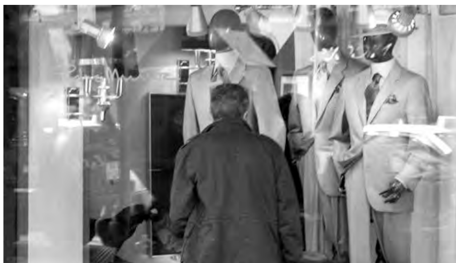
La época de rebajas puede paliar un poco la situación de los pequeños comercios./ Economía de Guadalajara