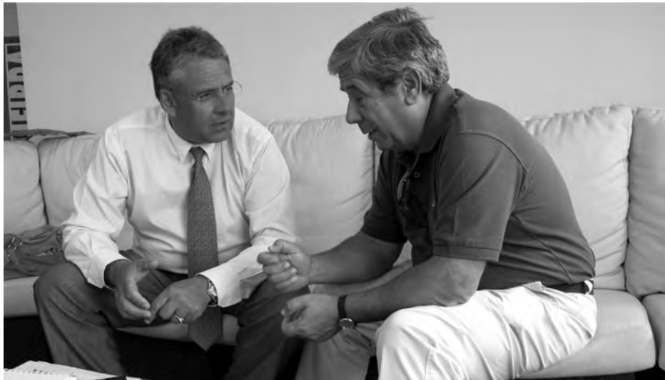
El Deportivo es un proyecto de futuro que espera verse respaldado por el apoyo de los aficionados./ Marta Sanz