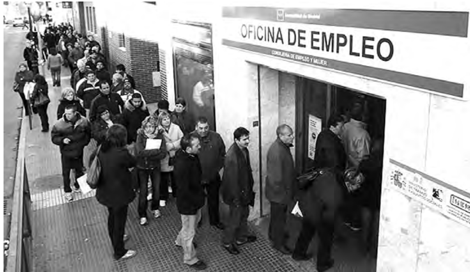
El estar en paro es una de las causas para que las familias no consuman o lo hagan menos.

Según una encuesta publicada en el último Cuadernos de Información Económica de la Fundación de las Cajas de Ahorros (Funcas). El 49% de los españoles teme quedarse en paro.