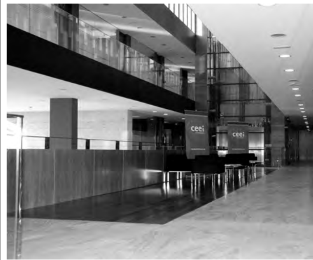
La preincuabadora se encuentra ubicada en el centro de empresas/E. de G.

El CEEI conforma un espacio de oportunidades y de creación de sinergias para los nuevos proyectos