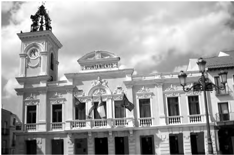
Los ayuntamientos podrán solicitar esta línea de ayudas para pagar a sus proveedores.

En este momento, los ayuntamientos tienen la capacidad de solicitar los préstamos ICO para pagar deudas de proveedores, exclusivamente. Por ello, desde CEOE-CEPYME Guadalajara, se pide a todos los ayuntamientos de la provincia de Guadalajara que tramiten, de forma urgente, esta solicitud, somos conscientes de que se tiene que celebrar un pleno donde deben aprobar la liquidación de sus presupuestos generales del año 2010 y solicitar, antes del 1 de diciembre de 2011, al ICO la aceptación para concertar operaciones de endeudamiento. CEOE-CEPYME Guadalajara pide que se haga sin demora porque cada día cierran empresas y los autónomos se ven obligados a cerrar sus ne-