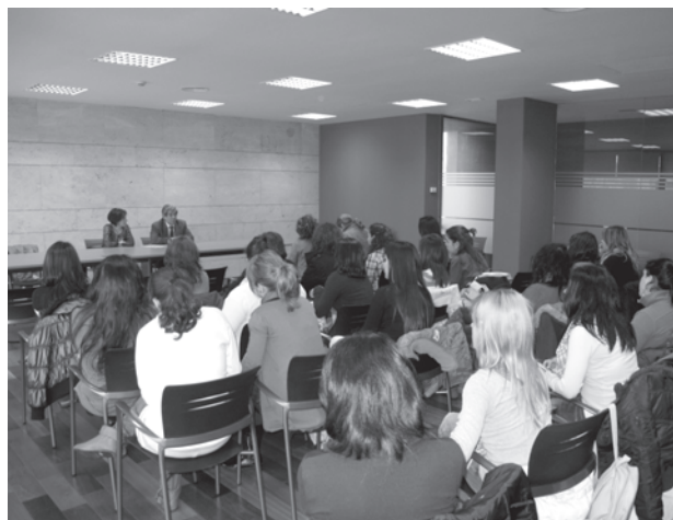
Una de las últimas reuniones organizadas en el CEEI.

Su incorporación se ha producido recientemente y servirá para que las empresas alcarreñas puedan participar en proyectos de innovación, tanto a nivel nacional como internacional