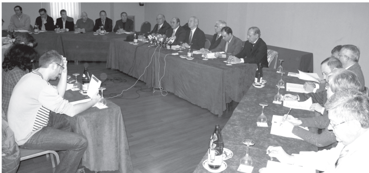
A la presentación acudieron 15 de los 27 candidatos avalados por la Patronal alcarreña.