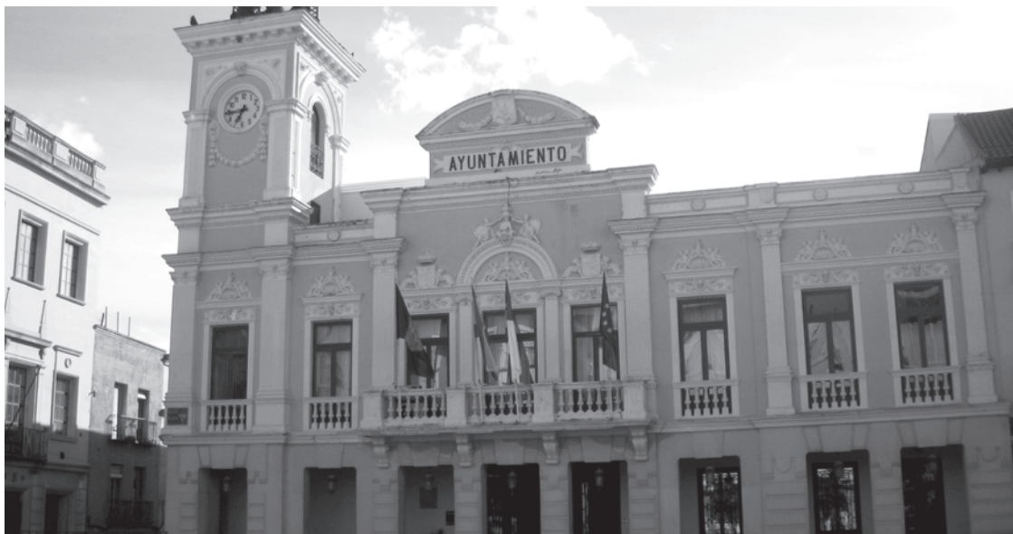
Los Ayuntamientos están tomando sus medidas para que la crisis les afecte lo menos posible.