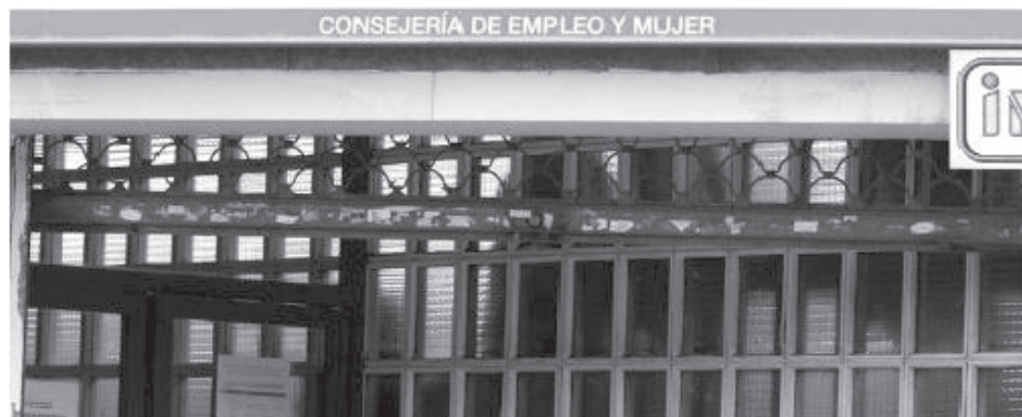
Los parados siguen acudiendo a las oficinas de empleo a registrarse como demandantes

Así, al finalizar el mes de febrero, el número de mujeres en paro sumaba 2.029.961, mientras que el de varones desempleados era de 2.100.664 personas.