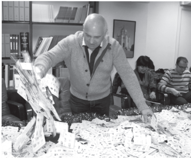
El presidente de FEDECO en una de las últimas campañas.

Más de 500 empresas comerciales de toda la provincia han participado con la Federación en el desarrollo de las actividades. La formación especializada como herramienta para mejorar la posición competitiva