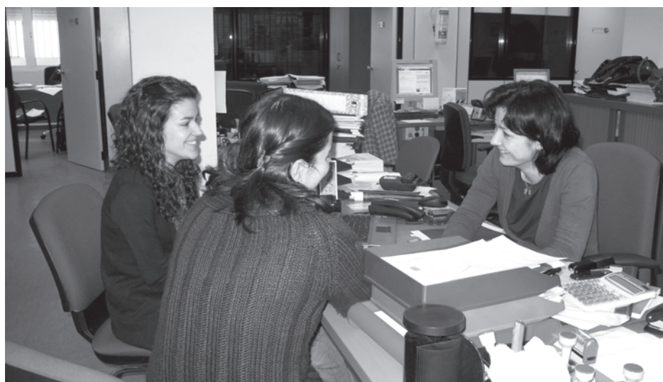
Los futuros emprendedores acuden en busca de asesoramiento e información./ Marta Sanz