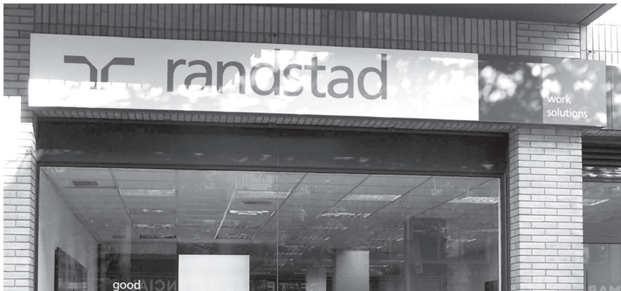
Las empresas de trabajo temporal siguen buscando y colocando a los trabajadores en las empresas. / Economía de Guadalajara