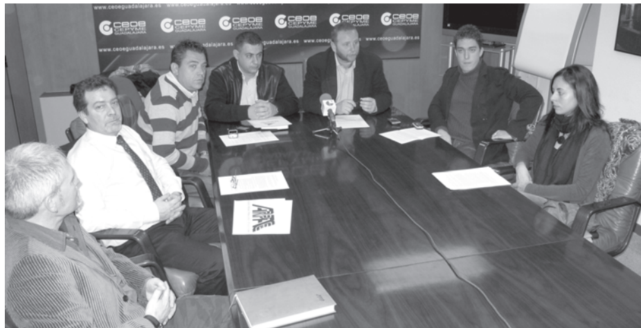
En la presentación estuvieron el presidente, vicepresidente, así como varios vocales./ Marta Sanz

Así, la defensa de sus intereses, como reconoció Pajares, es uno de sus principales objetivos. A los que hay unir otros como fomentar el decoro y la dignidad de la profesión, tomar acuerdos conjuntos para comparecer ante los organismos públicos, así como defender los intereses de la asociación, entre los que se encuentran como confirmaron los miembros presentes en la presentación de la Asociación de