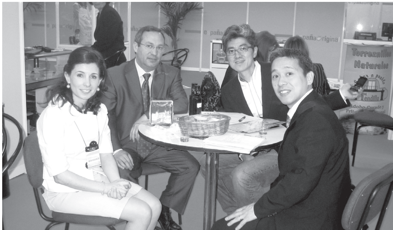
Un empresario alcarreño en una reunión durante la última edición de España Original.

Es la gran feria del negocio agroalimentario, tanto a nivel nacional como internacional con la presencia de más de 500 importadores de todo el mundo y más de 45 países. A la feria se acude en colaboración con la Diputación Provincial de Guadalajara