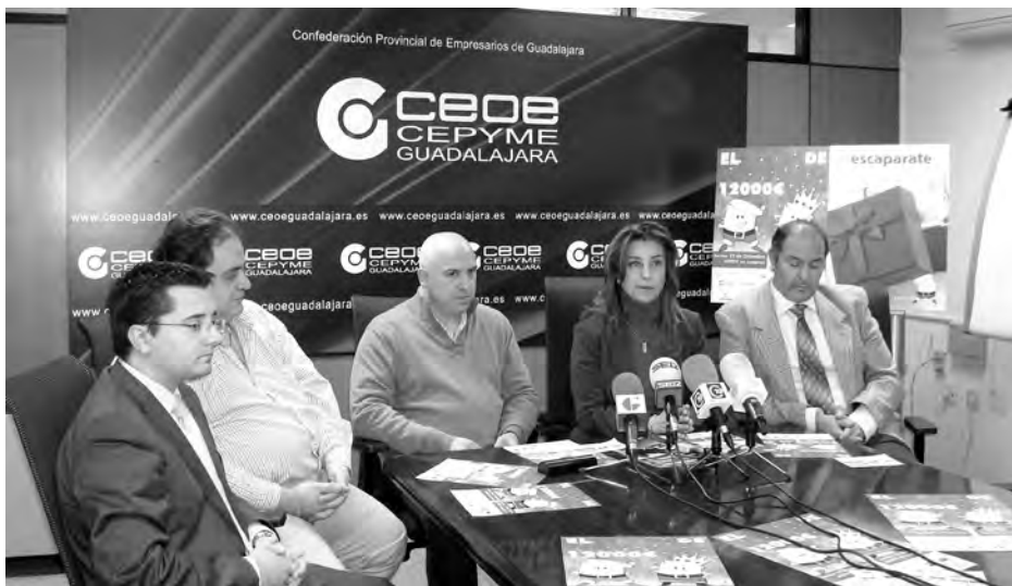
Los clientes podrán depositar sus papeletas en los establecimientos adheridos a la campaña./ Edurne Fernández