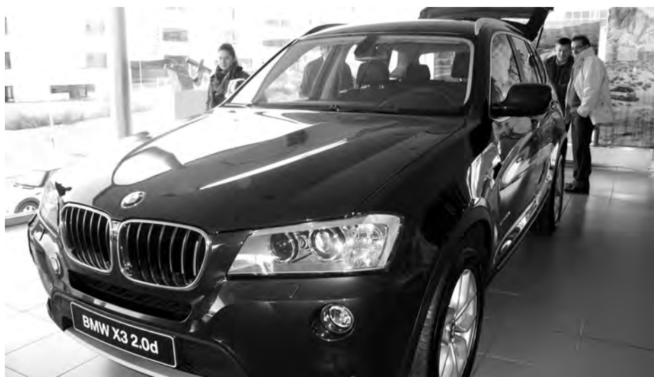
El nuevo BMW X3 ya se encuentra a la venta en el concesionario de Autoalcarria de Guadalajara.