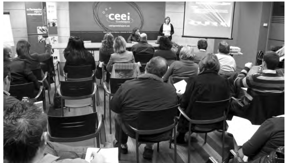
Más de 30 empresarios se interesaron por las ayudas a la contratación.

Las empresas pueden recibir ayudas a la contratación indefinida y a la contratación en prácticas para recién titulados, entre otras subvenciones regionales