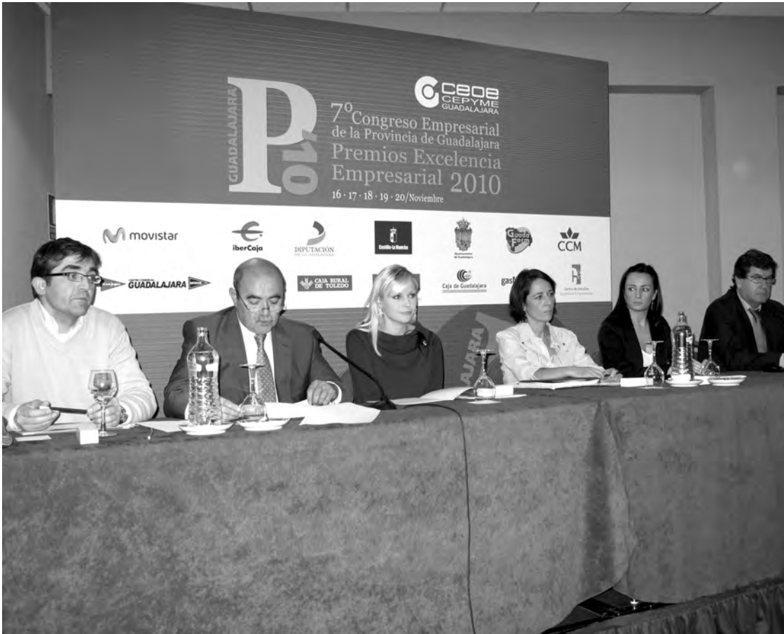
Las autoridades políticas apoyaron, con su presencia, todos los actos del 7º Congreso Empresarial de CEOE Guadalajara. / M.S.M.