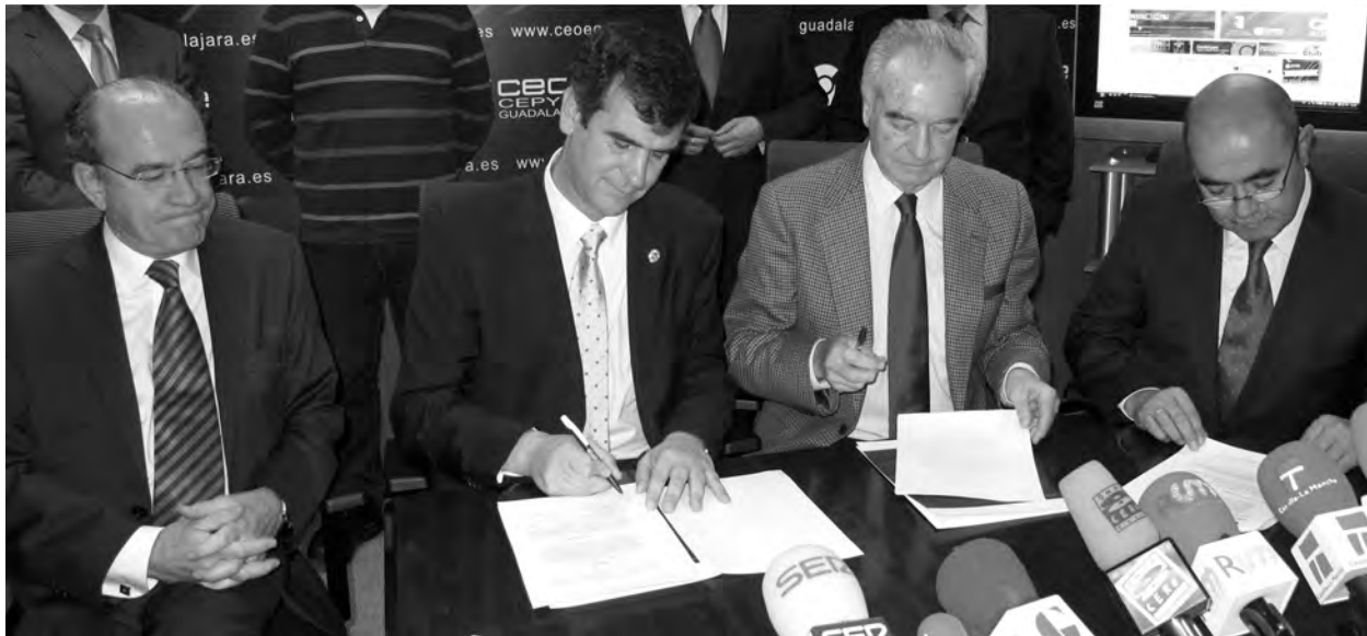
Momento de la firma de la cesión de la parcela por parte del Ayuntamiento.