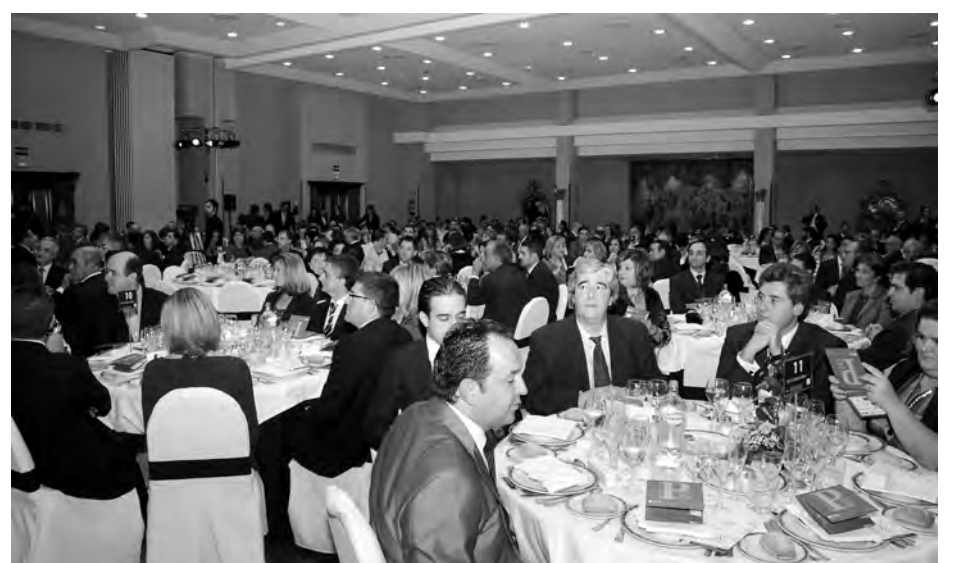
450 asistentes disfrutaron de una agradable velada tras la entrega de premios.