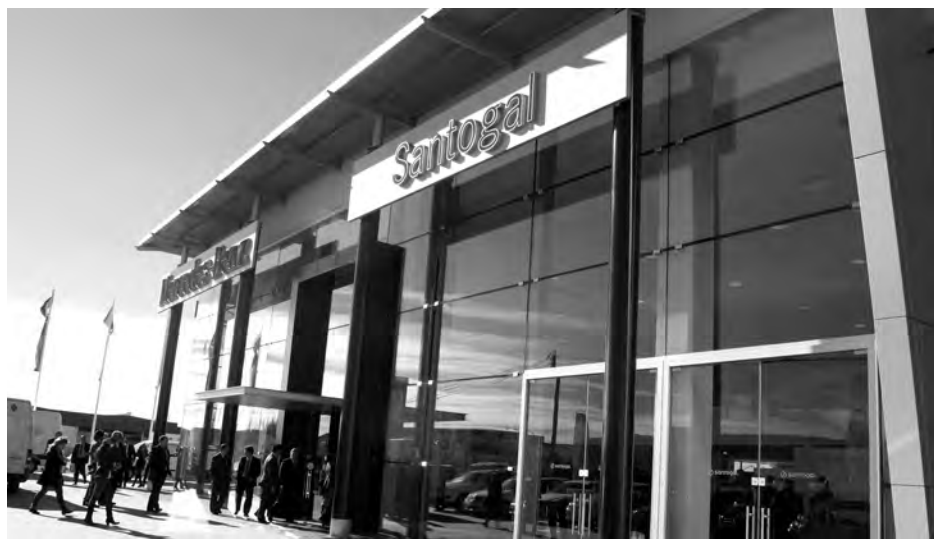
Las nuevas instalaciones del grupo Santogal se encuentran ubicadas en la Calle Francisco Aritio.