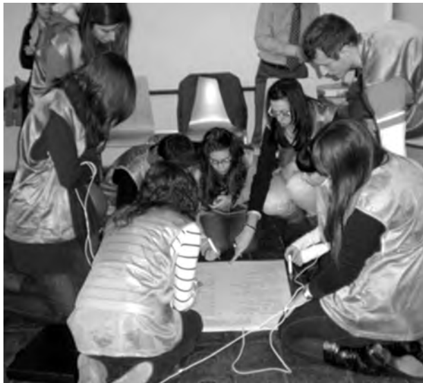
El trabajo en grupo ha sido importante en todas las jornadas.

Emprendedores de éxito han mostrado a los estudiantes como llegar a ser tu propio jefe