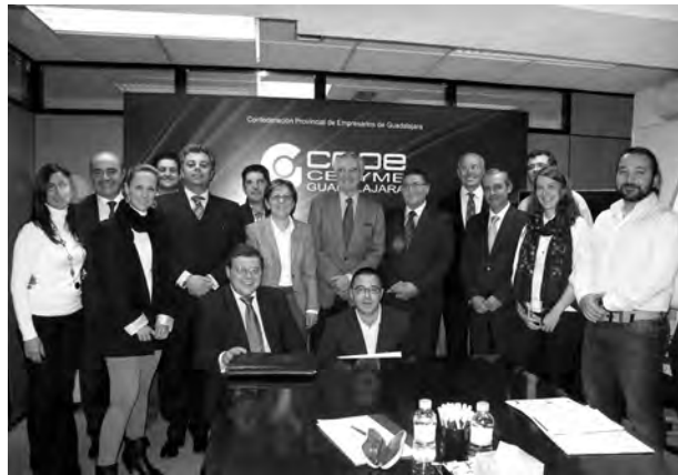
Los alumnos tuvieron que realizar un proyecto final.

Una formación que ha sido una gran oportunidad para mejorar la calidad y competitividad de las empresas alcañenas y que estas vendan fuera de nuestras fronteras lo que no pueden vender ahora mismo en nuestro país. Por lo que este curso se plantea como algo necesario para continuar con el crecimiento de la provincia de Guadalajara. Y que viene a