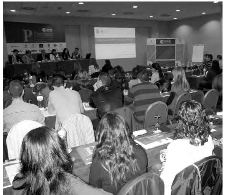
Los emprendedores aprendieron sobre comercio exterior.