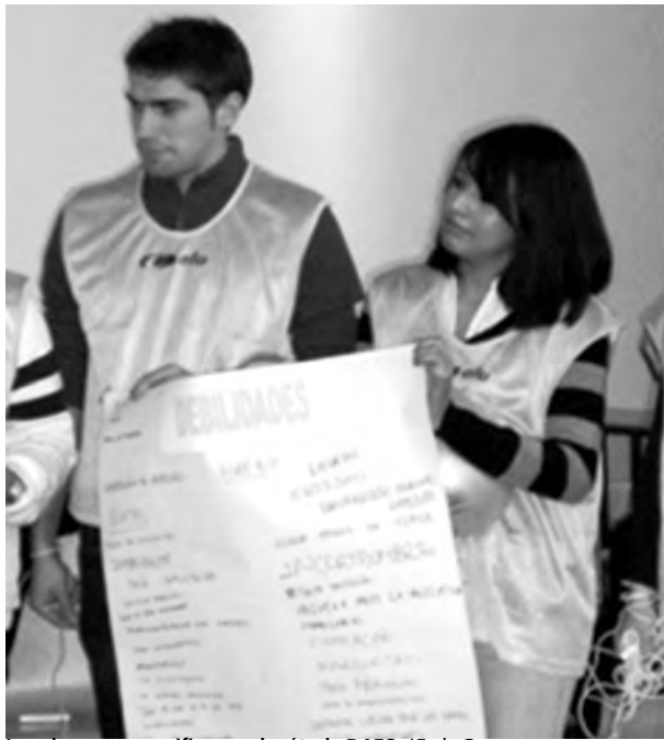
Los alumnos escenificaron el método DAFO.

El CEEI de Guadalajara y la Universidad de Alcalá, han dado por lo tanto un importante paso al frente y se sitúan en vanguardia en una estrategia necesaria para contribuir al desarrollo de un entorno socioeconómico más competitivo. Preparados para emprender es un proyecto pionero que se centra, a través de dinámicas lúdico y participativas, en mostrar y hacer aflorar estas cualidades y