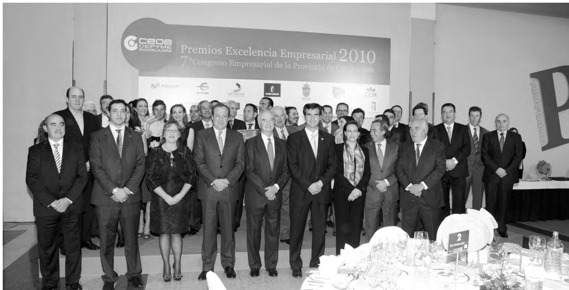
Foto de familia de todos los premiados con los patrocinadores de los Premios Excelencia Empresarial 2010.