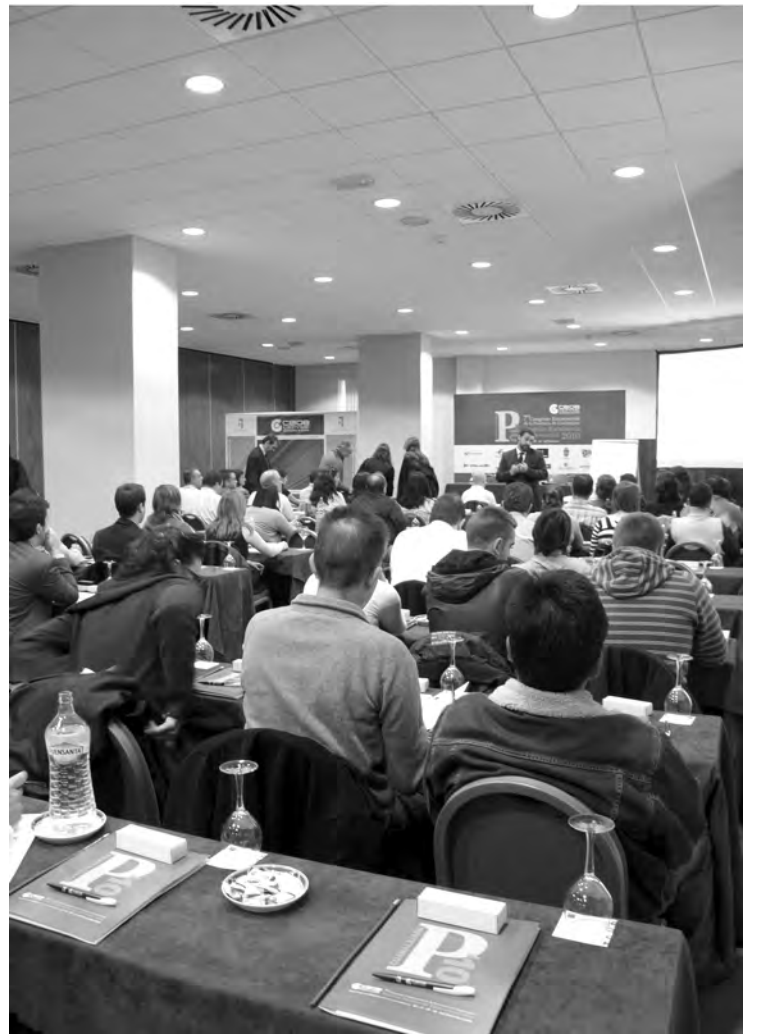
Cómo hacer presentaciones eficaces rompió el hielo de las jornadas. / M.S.M.