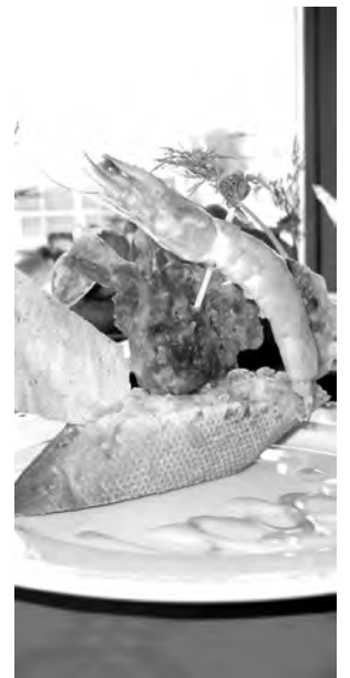
Tapa ganadora.

do, una cena para dos personas". Los ganadores de estos premios podrán canjearlos en cualquiera de los bares y restaurantes que han participado en esta edición de la Ruta de la Tapa por la provincia de Guadalajara. Una iniciativa que está organizada por la Federación Provincial de Turismo de Guadalajara y CEOE-CEPYME Guadalajara y que ha contado con el patrocinio del Ayuntamiento de Guadalajara, la Diputación Provincial de Guadalajara y la Junta de Comunidades de Castilla-La Mancha.