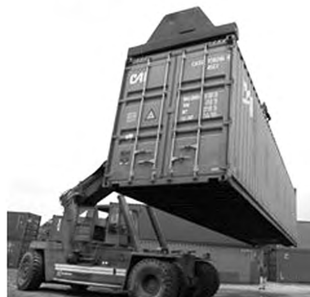
Bruselas también cree que la tasa de paro de España crecerá.

La Comisión constata que la economía española "parece haberse estabilizado en 2010, pero todavía no se ha embarcado en una senda sólida de recuperación".