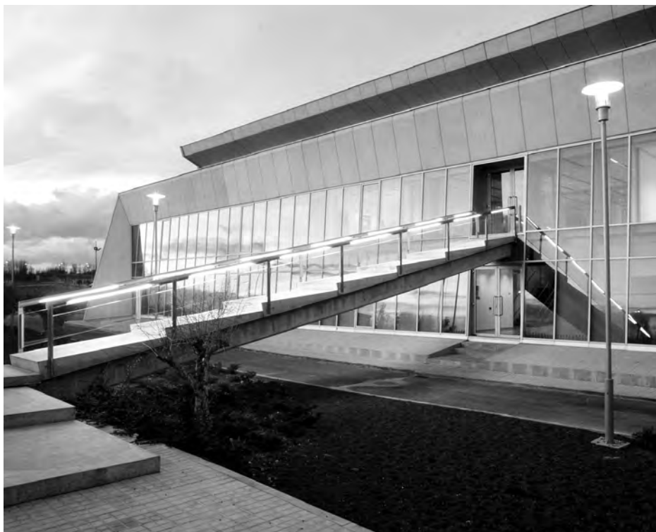
Fachada principal de la fábrica de SOCELEC en el polígono del Henares.

Fue en 2001 cuando SOCELEC, viendo su proyección de futuro, decidió vender las instalaciones en Madrid y trasladarse al Polígono Industrial del Henares, en Guadalajara, donde, gracias a sus buenas comunicaciones han seguido creciendo convirtiéndose en líderes de su sector