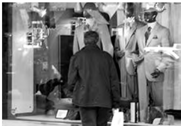
Los pequeños comercios están viendo reducidos sus ingresos.

Sólo las grandes cadenas presentaron en octubre tasas positivas, al haber in-