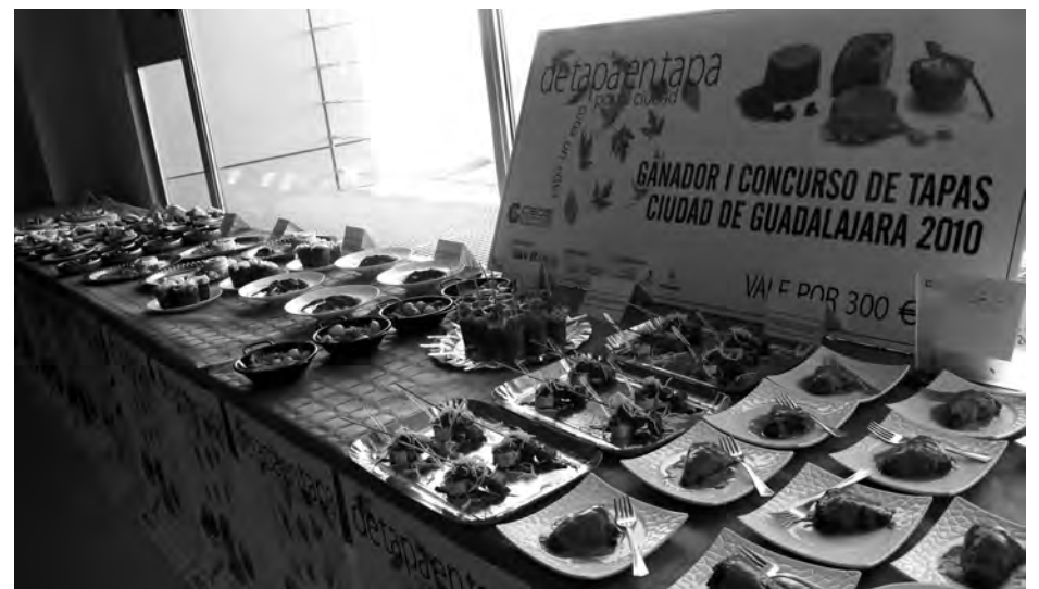
Durante la IV Ruta de la Tapa de Guadalajara se realizó un concurso de tapas.

Algunos de los establecimientos participantes han llegado a repartir más de 600 tapas en un día, lo que ha rebasado todas sus expectativas a lo largo de los dos fines de semana de Ruta