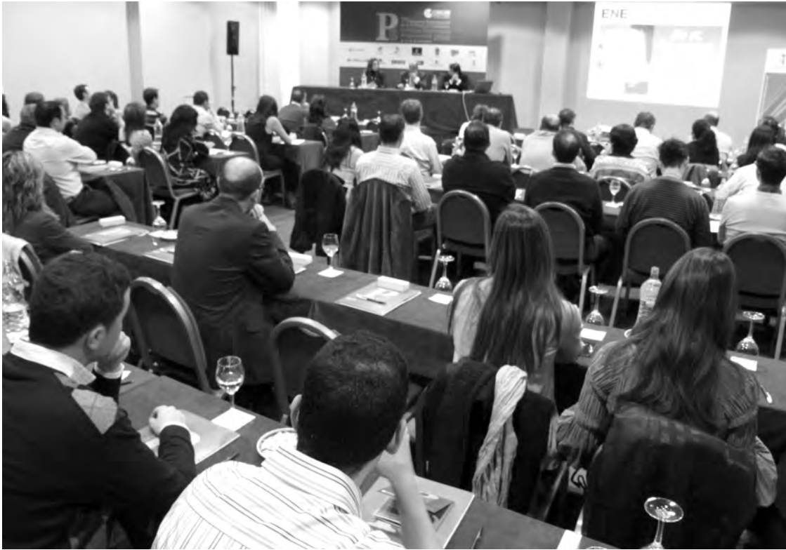
La jornada de negociación fue una de las más concurridas de toda la semana. / Marta Sanz