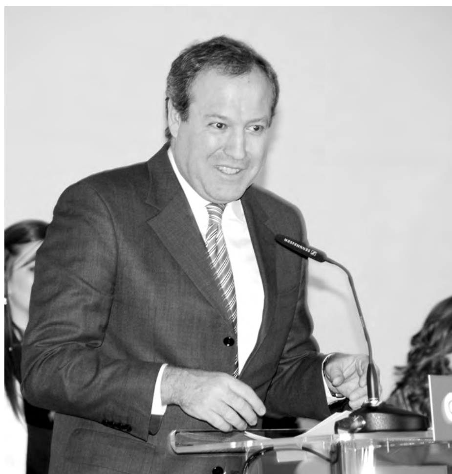
El presidente de CEPYME, Jesús Terciado, analizó la situación general de la pequeña y mediana empresa en España.