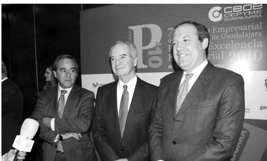
Los presidentes de CECAM, CEOE Guadalajara y CEPYME, en su atención a los medios.