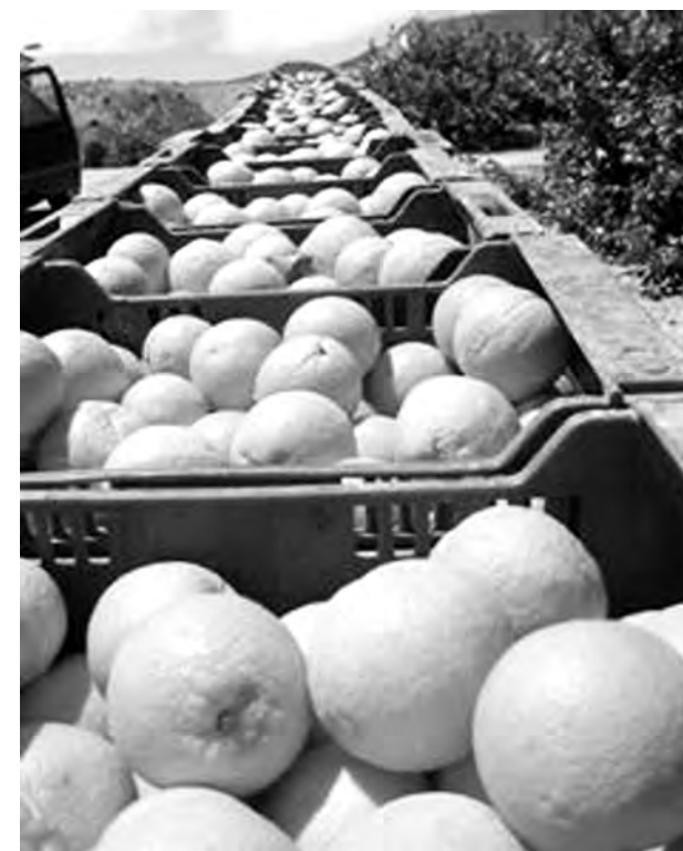
Los agricultores y ganaderos piden unos premios más justos.

En el caso de las producciones agrícolas, además de los cítricos, destacan las zanahorias, las cebollas y las berenjenas, que multiplicaron su precio por seis. En ganadería, la carne de cerdo y la ternera abandonan los mayores diferenciales entre origen y destino.