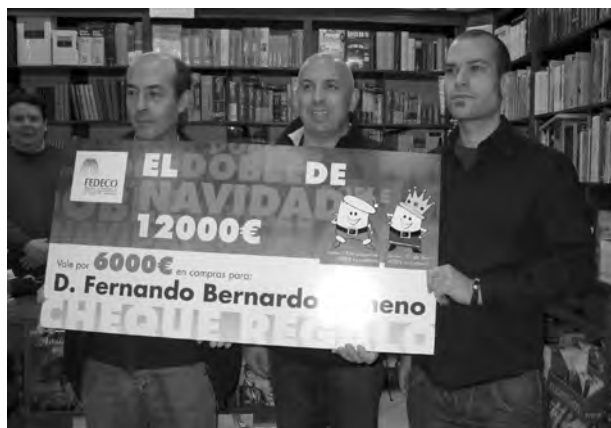
Un día de compras para gastar los 6.000 euros.