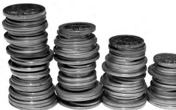
En 2011 se tendrán que llevar a cabo avances significativos.

"Es el momento para que todos y cada uno de los Estados miembros asuman sus responsabilidades", advirtió Trichet, quien abogó por fortalecer el Pacto de Estabilidad y Crecimiento.