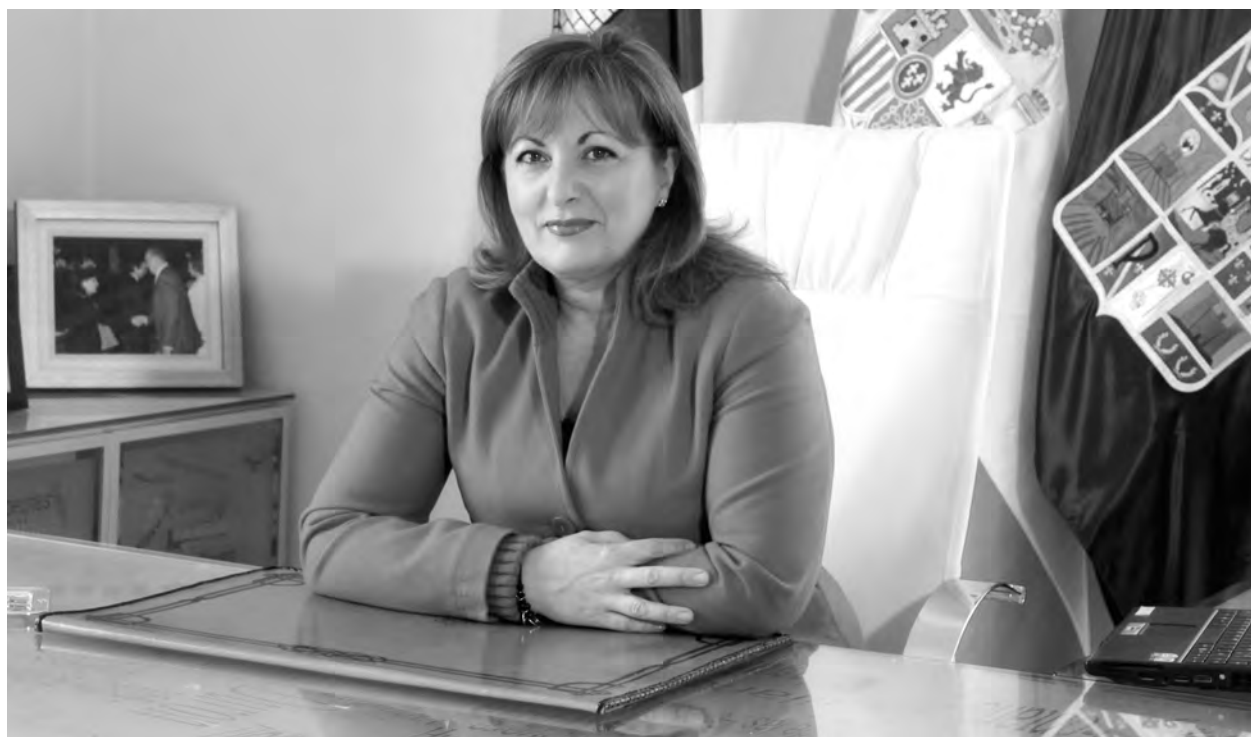
En el año 2011 se invertirán al menos 20 millones de euros más en los pueblos de la provincia.

En el contexto actual, los diferentes actores económicos, estamos llamados a hacer un ejercicio de responsabilidad para contribuir a poner las bases de la recuperación. Cada uno desde nuestro ámbito de competencia