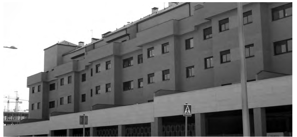
Las viviendas en las zonas céntricas de las ciudades serán más complicadas de encontrar.

Como conclusión, señala que en 2011 se mantendrá el ajuste en el nivel de la oferta iniciado al final de 2008 para adecuarse a un volumen de demanda inferior al de pe-