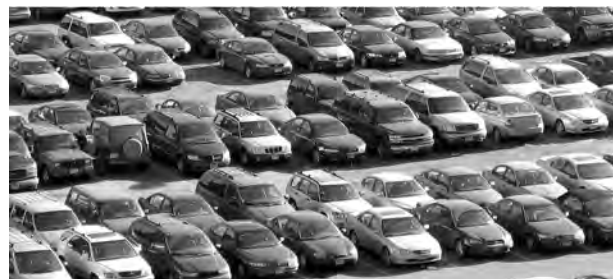
La venta de coches se va recuperando poco a poco.

Por canales, las ventas de automóviles a particulares bajaron un 11,3% a lo largo del año pasado, mientras que las compras de las empresas crecieron un 22,8% y las de las firmas de 'rent a car' se incrementaron un 68,6% en 2010.