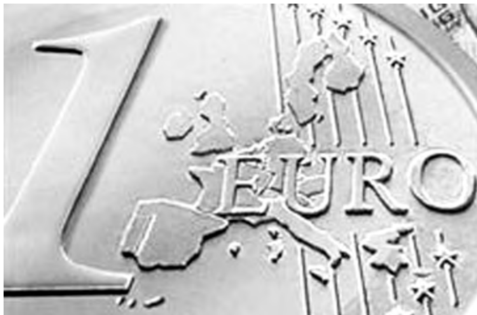
La política monetaria marcará el futuro del Euro./Economía de Guadalajara

La divisa europea comenzó el año en los 1,4325 dólares y llegó a alcanzar los 1,4582 dólares el 13 de enero, su nivel más elevado de 2010. A partir de entonces, el euro cedió posiciones frente al dólar y alcanzó su mínimo anual el 7 de junio, cuando,