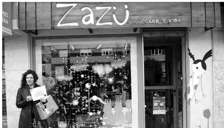
La dueña del establecimiento frente al escaparate ganador y su reconocimiento.

Pero a pesar de todo, cada día son más las transacciones que se realizan por Internet y mayor el volumen de dinero que se mueve.