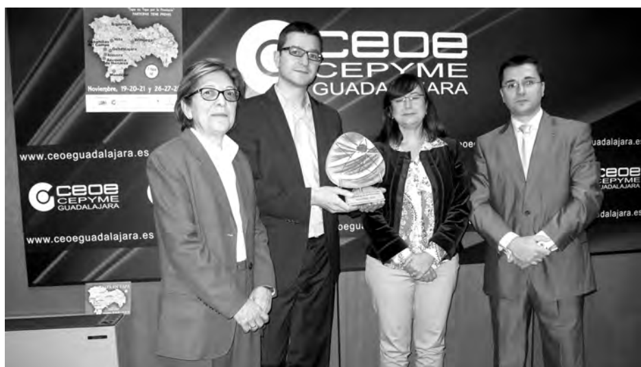
El bar-cafetería Atrio, de Sigüenza, fue elegido ganador de la mejor tapa por los clientes.