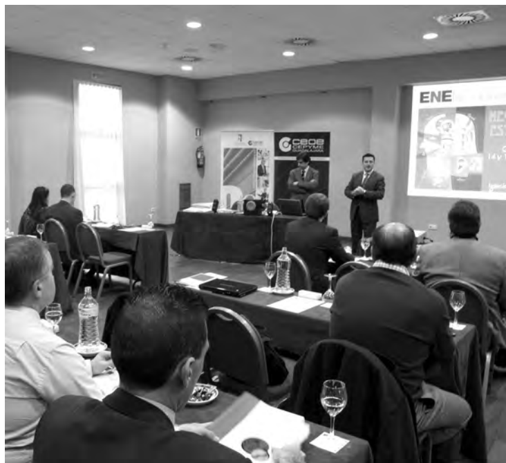
Los nuevos cursos darán comienzo en febrero.

2011 será el titulado "Liderazgo desde el sentido común. Entrenamiento en "Dirección y gestión de equipos", que tendrá lugar en dos sesiones de ocho horas cada una, concretamente los días 24 de febrero y 3 de marzo. Este curso está dirigido, principalmente, a los directores y propietarios de las empresas, directores de RRHH, así como a los mandos intermedios y personas con tareas relacionadas con la gestión o el trabajo en equipo. Esta jornada tendrá como objetivos, entre otros, el analizar el propio estilo de gestión de personas, viendo sus puntos fuertes y débi-