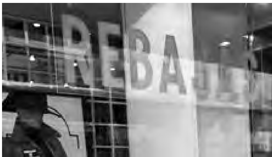
Las rebajas dieron comienzo el pasado 7 de enero.