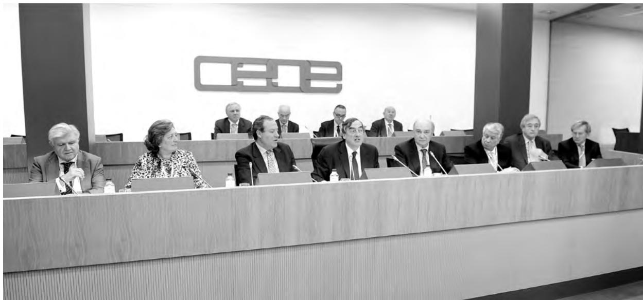
El nuevo presidente ha reducido el número de vicepresidencias de 21 a las nueve actuales.