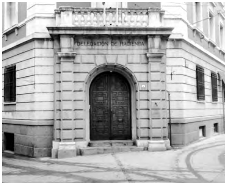
Las comunicaciones electrónicas ya son prácticamente generalizadas.

Y, ahora, la pregunta ¿Quiénes están obligados a recibir estas comunicaciones?, según el delegado