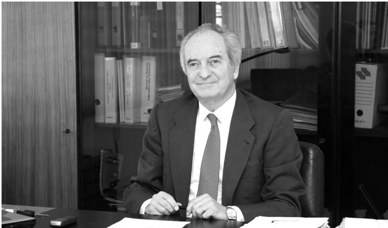
El presidente de CEOE-CEPYME Guadalajara confía en el buen hacer del empresariado para la recuperación económica.

La toma de las medidas estructurales necesarias y eficaces, junto con el acceso de la financiación por parte de las empresas, son dos de los puntos centrales para lograr que el 2011 sea el año en el que la economía española vuelva a crecer