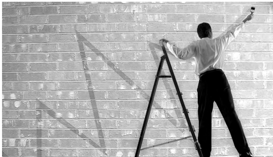
Tanto los ciudadanos como las empresas esperan que este 2011 sea el de la recuperación. /Economía de G.

Según el banco estadounidense Citi. Para crecer sólo un 0,2% en 2012. De este modo el crecimiento de la economía española se situará muy por debajo del resto de los países europeos