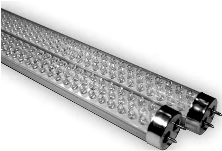
La tecnología LED ayuda al ahorro de costes, tanto en hogares como en las empresas.

Desde el día 1 de Enero han entrado en vigor las nuevas tarifas eléctricas, las cuales nos llevan a replantear con nuevas prioridades la necesidad de implementar sistemas de eficiencia en el consumo de energía eléctrica