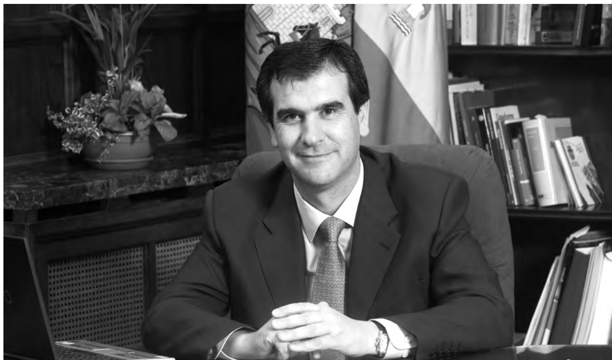
Las obras de nuevos parking y del Casco Histórico han sido de las más comentadas durante el año.

Este periodo ha estado marcado por la crisis económica y social. Donde la capital no ha sido una excepción y comienza el año 2011 con 20.354 parados en la provincia, detrás de los cuales existen familias completas que tienen que sobrevivir cercanas al límite