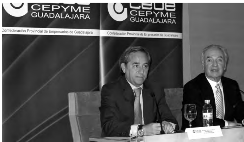
El presidente de CECAM expuso a los asistentes las realidades de las empresas de la región.