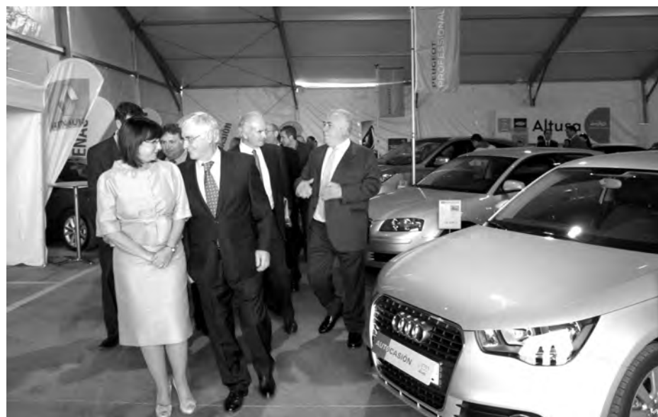
Durante Expo Guadalajara, los concesionarios mostraron su oferta automovilística. / Marta Sanz