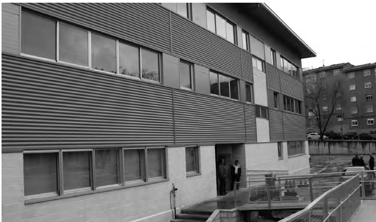
La sede de Cáritas Diocesana de Guadalajara se encuentra en la Avenida Venezuela de la capital.

Los perfiles de los demandantes de ayudas por parte de Cáritas ha ido cambiando según ha ido avanzando la crisis. Ahora es un 50% de nacionales y extranjeros y de familias jóvenes con hijos pequeños, así como las que integradas en la sociedad no tienen recursos