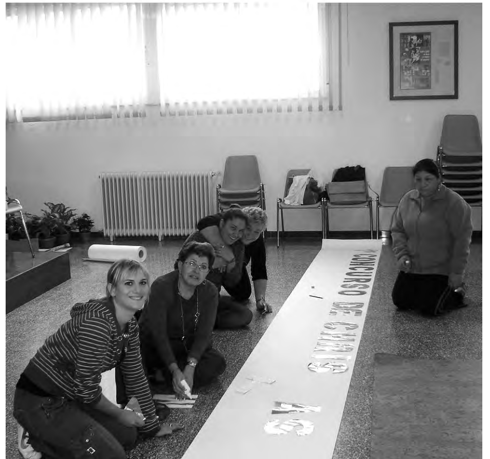
La formación y ayuda a las mujeres es una de las actividades que desarrollan.

Un trabajo que ayuda a hacer la vida más fácil a los más necesitados y que cualquier ayuda, ya sea con trabajo o en especie, siempre será bien recibido.