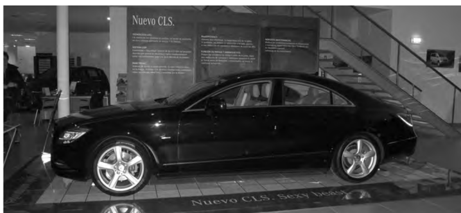
La segunda generación de un vehículo pensado para los conductores más exigentes. / Marta Sanz