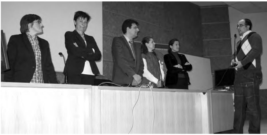
El equipo ganador mostró su satisfacción por poder poner en práctica lo aprendido. / Marta Sanz