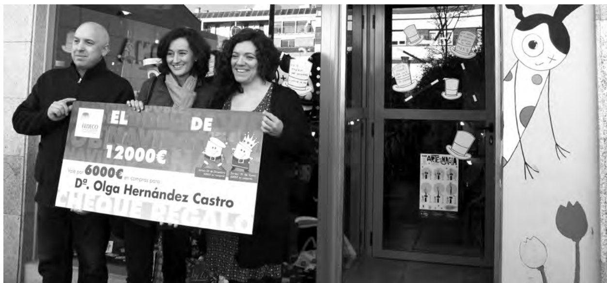
La premiada disfrutó del día gastándose el dinero en 17 comercios de Guadalajara./ Marta Sanz