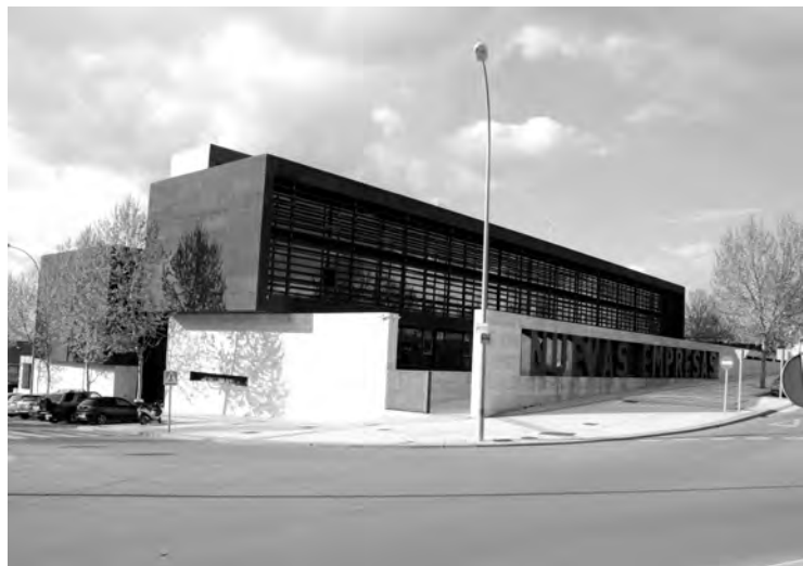
La incubadora está ubicada en el Centro de Europeo de Empresas e Innovación.

Con este proyecto el CEEI de Guadalajara ayudará a los jóvenes empresarios a poner en marcha sus ideas empresariales, además de asesorarles en cuanto a las ayudas y subvenciones disponibles de las diferentes administraciones en cada momento