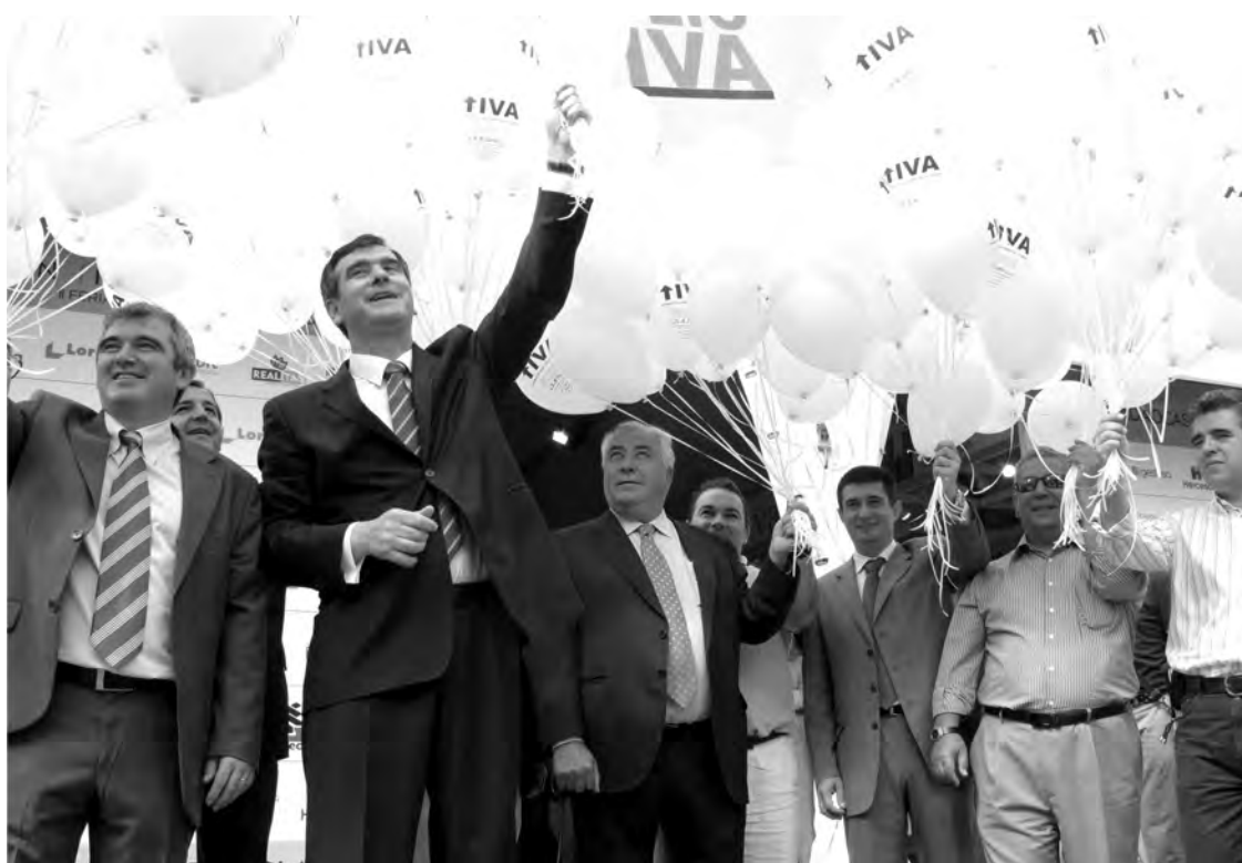
En la inauguración de la última edición estuvo presente el alcalde con los responsables de las promotoras participantes. / Marta Sanz

En España, la cifra de parados ha aumentado en 68.260, alcanzando los 4.299.263. Cifra que supone un nuevo record en número de parados. Todos los sectores se han visto afectados, pero especialmente el sector servicios con 39.569 desempleados más, seguido del colectivo sin empleo anterior, agricultura, industria y construcción.