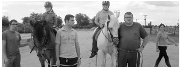
Integrantes de Cocemfe Asmicrip se beneficiaron de esta actividad

Gracias al constante e incansable trabajo de la organización y de la colaboración del consistorio del municipio, se pueden celebrar este tipo de jornadas. "El paraje está totalmente accesible, sobre todo para personas que están en silla de ruedas, ya que poseen rampas de madera, para acceder a cualquier parte", prosigue Uceda. El balance de este año ha sido "muy positivo", ya que socios, amigos y familiares de Cocemfe-Asmicrip pasaron un día distendido y agradable.