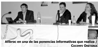
Afibro en una de las ponencias informativas que realiza