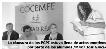
La clausura de los PCPI estuvo llena de actos emotivos por parte de los alumnos