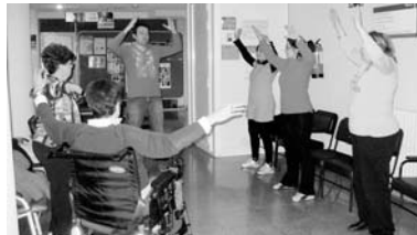
El Tai Chi ayuda a paliar los síntomas de la artritis