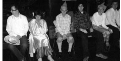
Imagen de los instantes previos a la representación