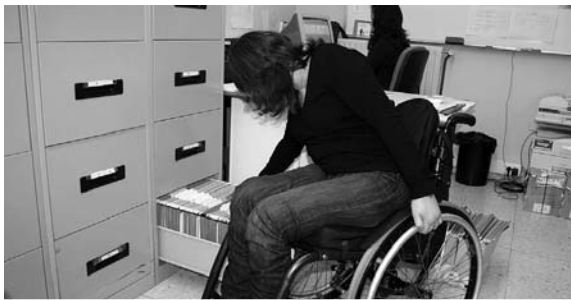
Imagen de una persona con discapacidad trabajando en un CEE

El Comité Español de Representantes de Personas con Discapacidad (Cermi) ha expresado su satisfacción por la decisión del Congreso de los Diputados, por unanimidad de todos los grupos par-