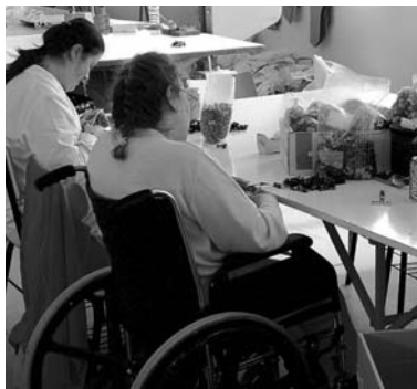
Personas con discapacidad trabajando

primero es necesaria la evaluación del sistema y luego los compromisos, en función de las disponibilidades presupuestarias, con los centros especiales de empleo sin ánimo de lucro y las personas con gran discapacidad.