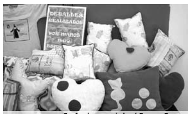
Confecciones variadas / COCEMFE ORETANIA

Según la entidad, este tipo de acciones es vital para las asociaciones en general y el colectivo en particular, puesto que la difusión es clave para que el resto de ciudadanos "nos respete, conozca y valore lo que las personas con discapacidad somos capaces de hacer y transmitir", concluye.