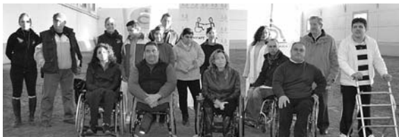
Foto grupo de integrantes de equinoterapia / COCEMFE ORETANIA

Existen muchos tipos de terapias, con muchos objetivos y destinados para diferentes colectivos y personas. Cada una de ellas, de esas terapias, cumple funciones determinadas y se orienta a mejorar algunas circunstancias en el receptor del programa. En este caso, la Equinoterapia es el programa que, con la ayuda del caballo, complementan la terapia que reciben enfermos y ayudan a que éstos mejoren ciertas habilidades o dolencias que padecen.