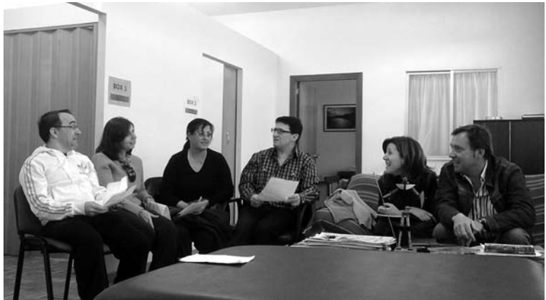
Imagen de una de las sesiones del grupo de autoayuda

Un grupo de autoayuda es la reunión periódica de un conjunto de personas que tienen una situación de vida o un problema común. Conscientes de esta situación, ellas en colaboración con algún organismo o entidad, establecen un lugar y unos días para reunirse, hablar y apoyarse. Aedem Ciudad Real apostó por esta iniciativa