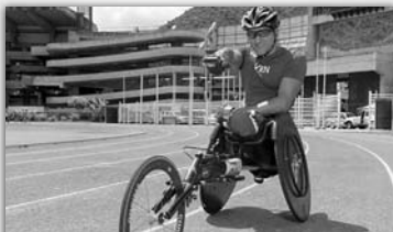
Deportista de atletismo adaptado / COCEMFE ORETANIA