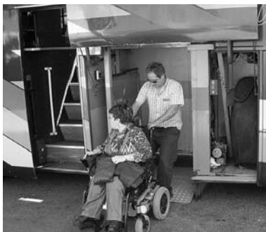
El conductor ayuda a subir a una persona con movilidad reducida