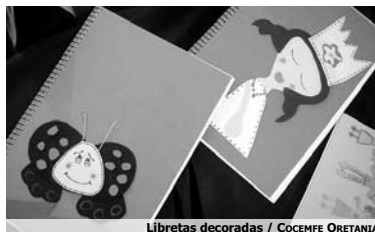
Libretas decoradas / COCEMFE ORETANIA