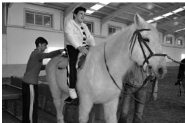
Actividad de equinoterapia / COCEMFE ORETANIA