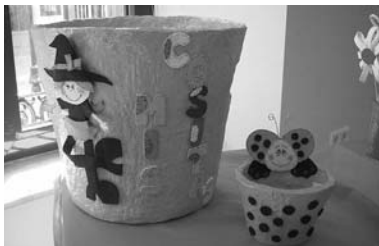
Objetos decorativos / COCEMFE ORETANIA