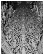
Mantón de una virgen bordado en oro / C. O.