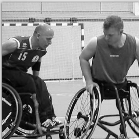
Cocemfe Puertollano en Granada / COCEMFE ORETANIA

El último partido de la temporada 2011-2012 se disputó en Granada. La última salida del equipo mancheo era dura, ya que se enfrentaba al líder de la categoría, un equipo con una amplísima trayectoria que le otorga una gran experiencia a nivel profesional y deportivo. La diferencia en el marcador fue más que considerable, un 93-39 que dejó a los aficionados granadinos muy satisfechos y a los mancheos con sensaciones negativas. El C.D. Prefabricados Calleja Arrayán salió a disputar el encuentro con grandes dosis de veterania y saber estar. Pronto se pusieron por delante en el marcador llegando al descanso tras el primer y el segundo cuarto con una amplia ventaja en el marcador. Los