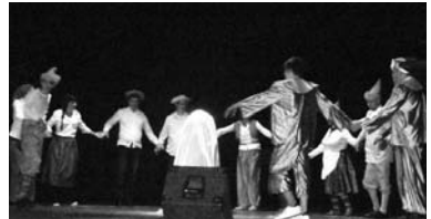
Integrantes de Oramfys interpretan la obra de teatro

sayando desde hace meses gustó a todo el público. Después llegó el turno de la copla y de los agradecimientos. Este hecho anima a Oramfys a seguir trabajando por las personas con capacidades diferentes.