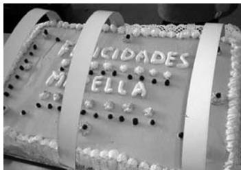
Un postre realizado en Valitadis / COCEMFE ORETANIA

en Malagón. En este espacio el equipo de Valitadis se encarga de llevar el servicio de barra y cafetería para el público en general, además de ofrecer las comidas de las personas que asisten a dicho centro. "Somos expertas en tapas y raciones", indican. Este equipo también cocina para los usuarios del