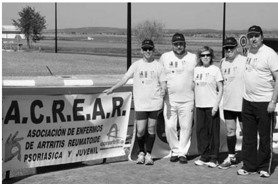
Miembros de la junta directiva con los tres principales atletas