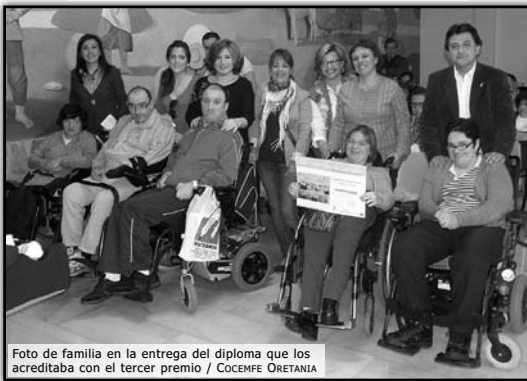
Foto de familia en la entrega del diploma que los acreditaba con el tercer premio