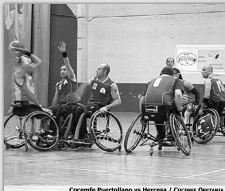
Cocemfe Puertollano vs Hercesa / COCEMFE ORETANIA

El BSR Cocemfe Puertollano disputó la última jornada como local frente al C.D. Hercesa. El equipo de Puertollano saltó a la cancha con ganas de llevarse la victoria contra el conjunto madrileño. Había ciertas ganas de 'revancha' pues este equipo frenó la buena racha del equipo en los partidos de la primera vuelta. Las intensas jugadas pronto reflejaron las intenciones de los madrileños, llevarse nuevamente los tres puntos que los consolidaran en los primeros puestos de la clasificación. Sin embargo, el marcador fue inaugurado por los mancheos. Dos puntos primero y una falta que se saldó con un tiro libre que también fue anotado. Pero los chulapos no tardaron en abrir el suyo y llegar al final del primer cuarto con un marcador favorable, a pesar de ser ajustado, los madrileños consiguieron un 12-14.