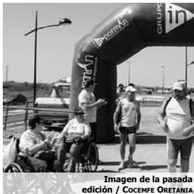
Imagen de la pasada edición

Sendos deportistas reconocieron que la sociedad ciudadrealista se volcó con ellos en la pasada edición, por lo que esperan que ésta sea un nuevo éxito. Por su parte, Acrear se adhiere a la invitación de éstos y pone a disposición su página web: www.acrear.org y el correo electrónico: running24h@acrear.org para cualquier ciudadano o deportista que quiera recibir más información sobre el acto.