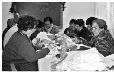
Las socias practicando el bordado / COCEMFE ORETANIA

salir nuevamente elegida, concretamente el inicio de nuevos talleres para mantener vivo el espíritu de convivencia y compañerismo entre sus socios. Por ello se hizo un nuevo llamamiento a los socios para que crezca la ilusión por participar en las diversas actividades que la asociación preparará para los próximos meses.