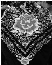
Detalle de un mantón de manila / COCEMFE ORETANIA