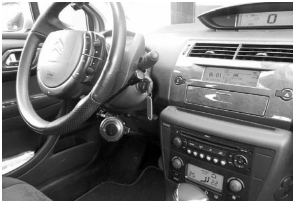
Adaptación del vehículo en el interior

De esta manera, y pensando en todo momento en el colectivo, desde el año 2007 Cocemfe Oretania Ciudad Real dispone de dos automóviles con grandes prestaciones. "Éramos conscientes de que la realidad a la hora de conseguir este permiso siempre se repetía y había que hacer algo para solventarlo", aseveran. Y es que, cuando una persona con movilidad reducida se planteaba sacarse el carné tenía primero que comprarse el coche. "Este hecho ya supone un gasto, puesto que cuando una persona se fija una meta, en este caso obtener el permiso de conducción, no sabe si logrará superarla o no". Además de este hecho, casi insulto para cualquier ciudadano, la persona con movilidad reducida tenía que equipar el ve-