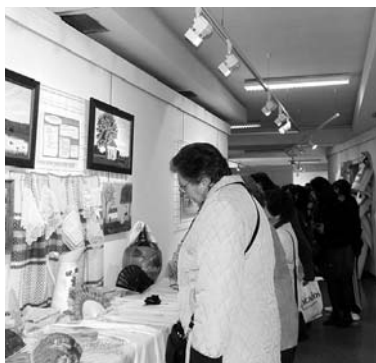
Personas visitando la exposición / MARÍA JOSÉ GARCÍA