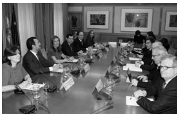
La ministra Mato, con el CERMI

Unida a esta Ley, que ha reconocido es una vieja petición del CERMI, ha señalado que se pondrá en marcha también un Plan de Integración de Discapacidad y un Pacto Sociosanitario también, algo que propondrá a todas las comunidades autónomas, en el que ya se trabaja, y asimismo al Congreso y el Senado.