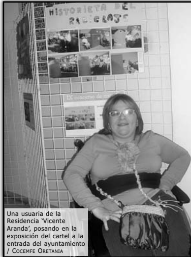
Una usuaria de la Residencia 'Vicente Aranda', posando en la exposición del cartel a la entrada del ayuntamiento

El alcalde de Daimiel, que fue el encargado de entregar los premios, junto a las concejales del