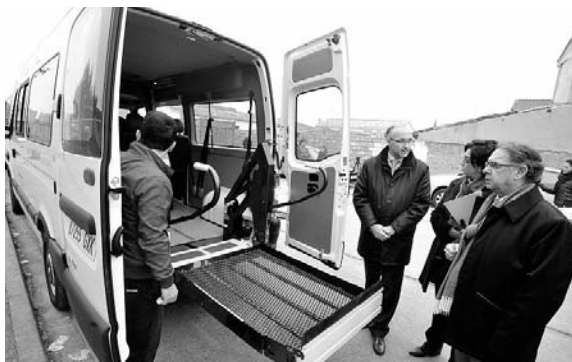
Vehículo adaptado / COCEMFE ORETANIA

El programa de "Transporte Adaptado Puerta a Puerta" nació en 1990 y a lo largo de estos años ha ido adaptándose a las necesidades y circunstancias de cada momento. "Las personas suelen acudir a