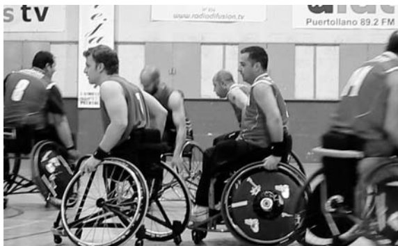
Un momento del partido

El BSR Cocemfe Puertollano inicia el año con dos derrotas consecutivas, aunque una de ellas no es definitiva