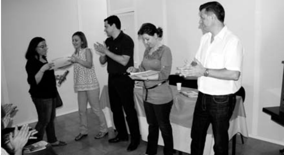
Imagen de archivo de la clausura del último curso impartido por Oramfys / Cocemfe Oretania

De esta manera, los diecisiete alumnos ya han desarrollado los siete módulos lectivos que integran la parte teórica de curso y a mediados de enero iniciaron las prácticas en la Residencia de Mayores Virgen del Monte, ubicada en la misma localidad. "Creemos que es un curso muy completo pues las prácticas es la mejor forma de asimilar e incluso ampliar los conocimientos que ya han aprendido", argumenta. Una teoría que se ha basado en