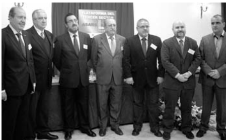
Representantes de los colectivos integrados / COCEMFE ORETANIA

El expediente, que afecta a 37 trabajadores, es consecuencia de los continuos impagos que se vienen sufriendo desde el pasado mes de junio. Un hecho al que se suma la incertidumbre en cuanto a la concesión de nuevas subvenciones y programas. Se han visto afectados servicios como el programa de Dinamización Asociativa o la Oficina Técnica de Accesibilidad, entre otros.