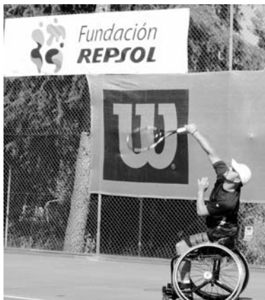
El tenis en silla de ruedas es una de las modalidades de las paraolimpiadas

Por otra parte, la Asamblea General, presidida por Miguel Carballeda, aprobó el Plan de Preparación (Plan ADOP) de los deportistas, correspondiente al decisivo año 2012, y en el que se incluyen las becas económicas y las partidas destinadas a concentraciones, competición internacional, servicio médico o al Plan de Alto Rendimiento Para-