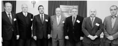
Representantes de la Plataforma del Tercer Sector / COCEMFE ORETANIA

Fundación ONCE ofrece una beca para estudiantes con discapacidad