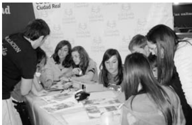
Un grupo de jóvenes en plena actividad

De esta manera, Cocemfe Ciudad Real fue invitado a esta importante cita para dar ejemplo y concienciar a los más jóvenes sobre las dificultades que tienen otras personas, jóvenes como ellos, con las mismas ilusiones y retos, pero que tie-