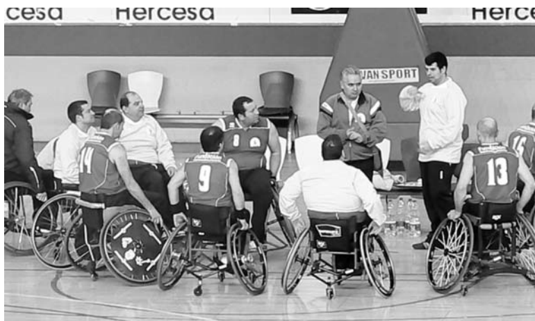
Los jugadores del Cocemfe Puertollano con los entrenadores