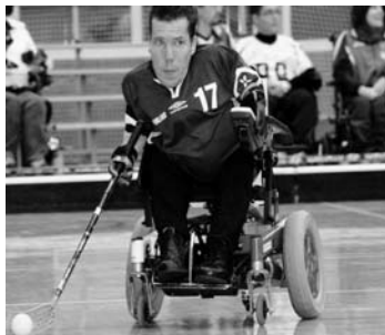
Hockey en Silla de Ruedas

Entre los nuevos paralímpicos de alto nivel figuran, por ejemplo, los 12 jugadores de baloncesto en silla de ruedas que lograron la medalla de bronce en el Campeonato de Europa celebrado el pasado mes de septiembre en Nazaret (Israel), éxito que hará que España vuelva a tener representación de este deporte en unos Juegos Paralímpicos (los de Londres 2012) después de la cita de Atlanta'96.