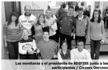
Las monitoras y el presidente de ADIFISS junto a los participantes