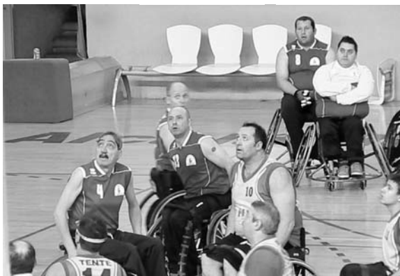
El Cocemfe Puertollano en Alcalá de Henares

No es la primera vez que el Arrayán incumple las normas básicas que la Federación impone a todos los equipos, puesto que la temporada pasada las incumplió hasta en cuatro ocasiones, siendo penalizado por esto, con el castigo que se contempla para estos casos, que es dar el partido por perdido al equipo infractor además de quitarle un punto de la clasificación general, por lo que todo queda a expensas de la sanción que la Federación imponga al Arrayán.