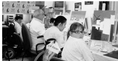
Imagen de archivo de arteterapia

Asmicrip-Cocemfe solicita por ello el esfuerzo de toda la ciudadanía, animándola a participar en lo propuesto, "ya que la consecuencia más directa es el bien de nuestros asociados", concluye. Asimismo anima a los asociados a no decaer en estos difíciles momentos, para lo que propone el apoyo de unos en otros a través de las actividades que realizan siempre, aunque este año supongan un mayor esfuerzo económico.