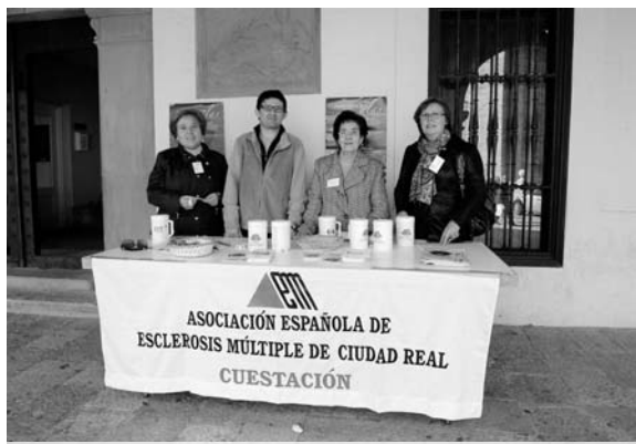
Imagen de archivo de una de las cuestionarios

Los ciudadanos siempre han recibido con los brazos abiertos las iniciativas de esta organización, AEDEM