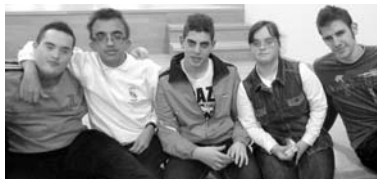
Imagen de la fiesta de clausura del taller