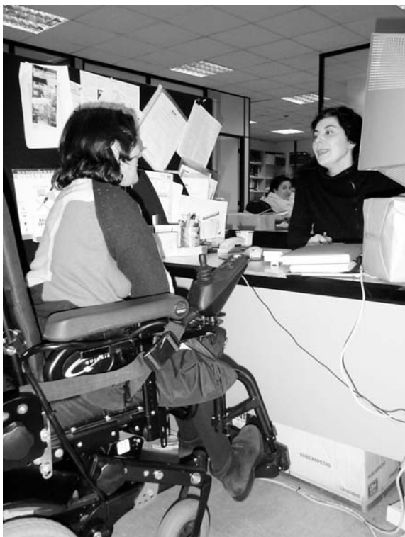
Una persona con discapacidad en búsqueda de empleo

El objetivo final de este reto es articular un conjunto de medidas más