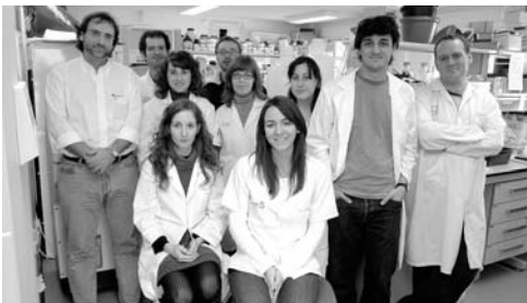
Investigadores del Hospital Nacional de Parapléjicos en Toledo

El objetivo del proyecto es desarrollar sis-