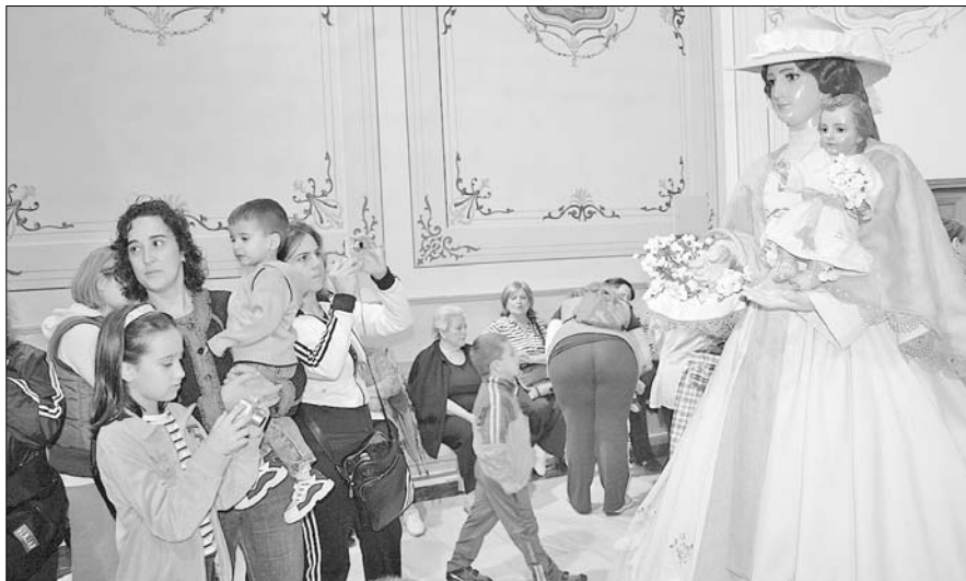
El sábado 25 de octubre se procesionaba junto a la Virgen de los Santos, que al día siguiente regresa a su santuario

La recepción oficial de la imagen se mantuvo tal como estaba programada, produciéndose alrededor de las 20:00 horas y con la participación de los represen-