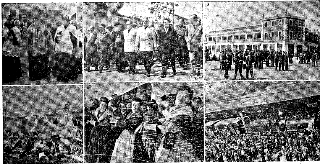
SEIS MOMENTOS DE LOS ACTOS DEL DÍA 22.