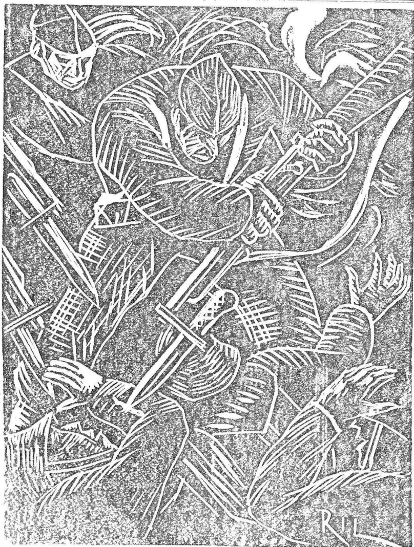
Con estas "razones" el Pueblo español aplastará a las hostias que forman el ejército mercenario de Franco. (Grabado de RIL)

Colectividad Obrera C. N. I.; García Hernández, 15 — Alcázar.