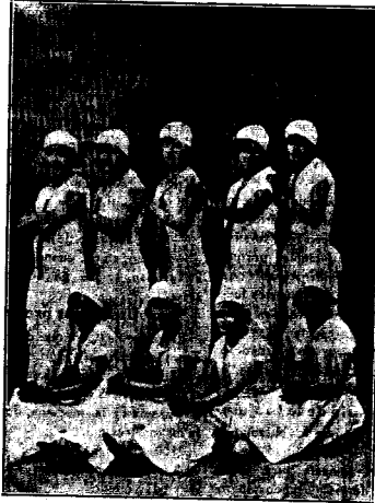
Grupo de encantadoras señoritas de Casas Ibáñez que han obtenido un gran éxito con sus disfraces en los bailes de Carnaval.

Las demás noches continuaron los bailes en el mismo local y en los de los Círculos «Liberal» y «La Unión», y en ellos se destacaba un hermoso plantel de mujeres simpáticas y bellas de Casas de Vés, Cenizate, Mahora y otros pueblos, juntamente con las de Casas Ibáñez; y la alegría, y la gra-